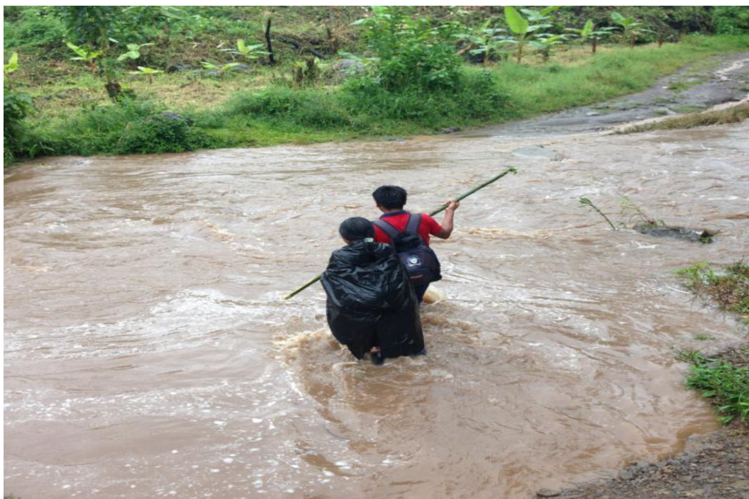
Nota: Contexto de Sharabata

La comunidad cuenta con varias organizaciones “Asociación de Desarrollo Indígena, Junta de Educación, Patronato Escolar Comité de Deportes” (Chalampunte 2012, p.33). Además, se encuentra la Asociación de Mujeres que orientadas desde la institución educativa, se dedican a trabajar mediante cultivos agrícolas a base de abono orgánico y plantas propias de la comunidad y representa un aporte en la equidad y participación de género. Su trabajo también es un aporte hacia una mayor protección ambiental y promoción cultural.