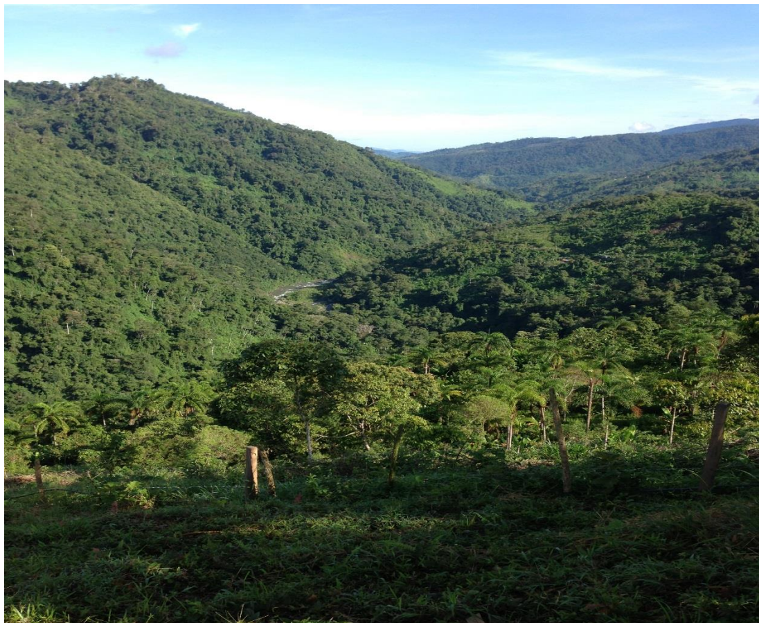
Nota: Paisaje de la Comunidad de Sharabata, Alto Chirripó

Como parte de la indagación de campo, se obtiene el significado del nombre de la comunidad, la cual pasó por algunas denominaciones como Siruryaka, Chorrobata y finalmente Sharabata; palabra Cabécar que significa “el río donde la gente comía chile”. En alusión a las personas que viajaban de lejanas comunidades y mientras descansaban junto al río, comían sus provisiones con chile y dejaban sus migajas a orillas del río. Por lo que la traducción de la palabra Sharabata, corresponde a “La loma, del río donde los viajeros comían chile”.