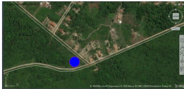
Figura 4. Localização do manancial e reservatório.