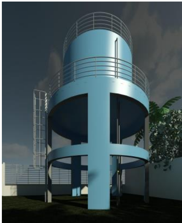
Figura 3: Reservatório elevado.

O reservatório obtido deverá possuir volume de 32m 3 com a finalidade de minimizar a quantidade de horas ligadas do conjunto motor-bomba, a fim de potencializar a utilização deste e do sistema fotovoltaico. A localização do reservatório assim como o manancial, foram definidos a partir da interação comunitária e adotando-se como critério técnico, que fosse localizado em um dos pontos mais altos da comunidades e por meio do SIG foi constatado que localiza-se como o exposto na Figura 2. Deste modo, a representação virtual deste reservatório pode ser observada na Figura 3.