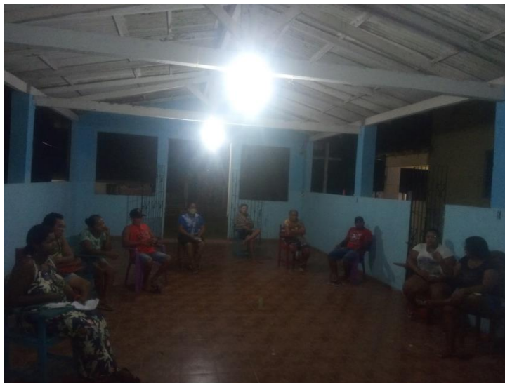
Figura 5. Interação comunitária.