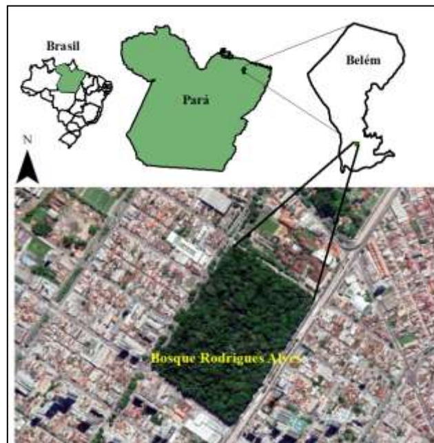
Figura 1. Área de coleta de sementes em matrizes de Parahancornia fasciculata (Poir) Benoist no Bosque Rodrigues Alves Jardim Botânico da Amazônia no município de Belém-Pará.

Foram coletados frutos maduros, após a ocorrência da dispersão natural em matrizes de P. fasciculata localizadas no Bosque Rodrigues Alves – Jardim Botânico da Amazônia (BRAJBA). O BRAJBA é um fragmento com área de 15 ha composto por floresta ombrófila densa não aluvial nativa situado no centro da cidade de Belém-PA (1°25'48,7''S 48°27'24,71'' W) (Figura 1).