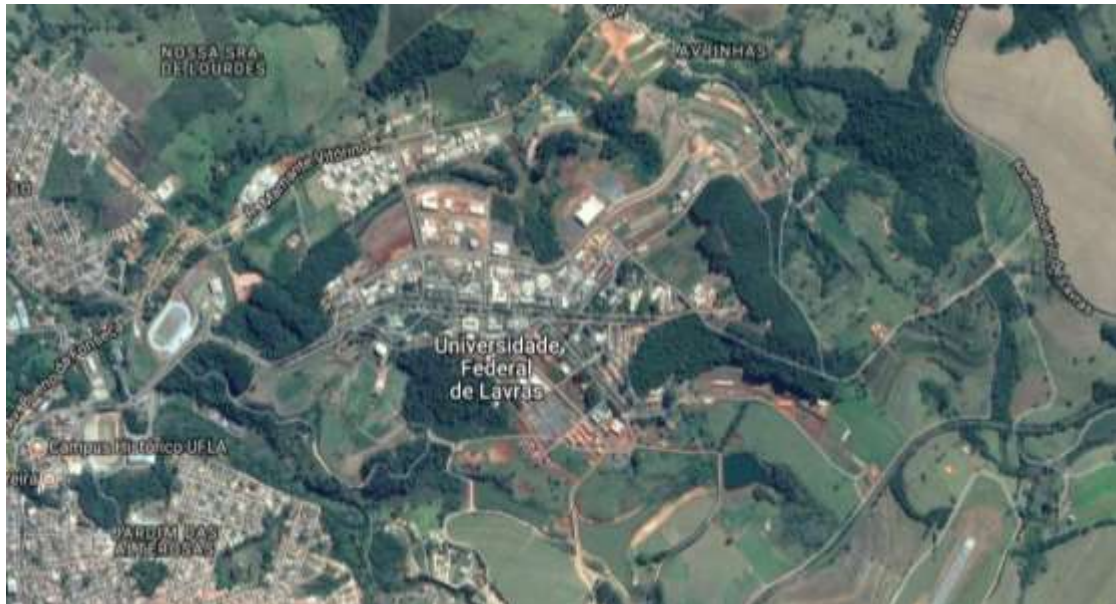
Figura 1. Ilustração do campus da UFLA.

Estes são apenas alguns exemplos, visto que muitos projetos de pesquisa e extensão são realizados no intuito de colaborar para o desenvolvimento de atitudes responsáveis com meio ambiente. Na Figura 1 é possível observar a UFLA e toda sua extensão, como a parte arquitetônica, as áreas verdes e algumas trilhas dentro do campus.