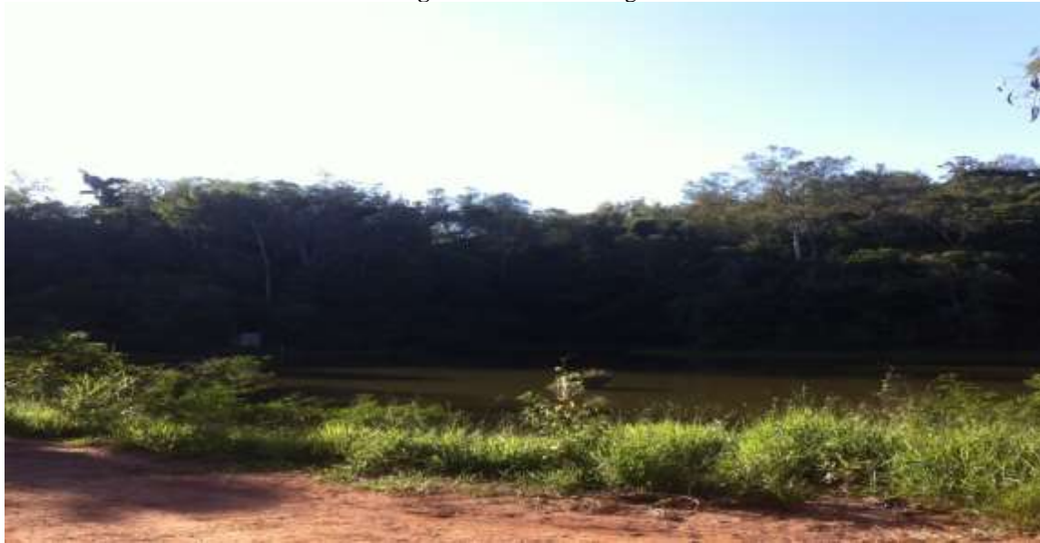
Figura 2. Trilha das Lagoas.