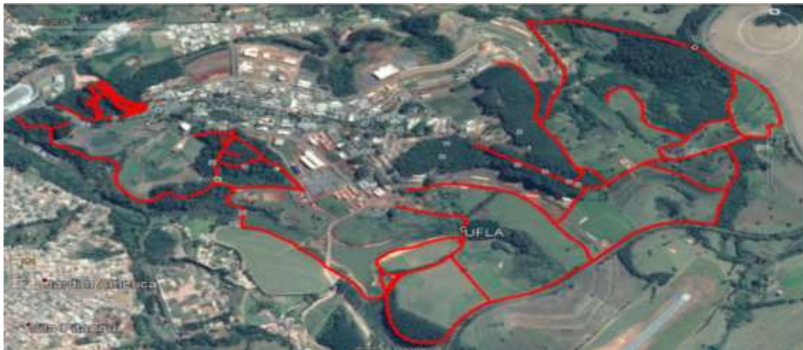
Figura 3. Trilhas mapeadas na UFLA.

A metodologia empregada na pesquisa foi a quali-quantitativa (Pereira et al., 2018). As trilhas foram mapeadas por caminhamento usando um aparelho GPS Garmin, modelo GPSMAP 62 sc. Posteriormente os dados coletados foram transferidos para o programa Base Camp, que tem como função traçar a rota do percurso, e em seguida os dados foram plotados para o Google Earth, fornecendo a imagem por satélite de toda a extensão da trilha (Figura 3).