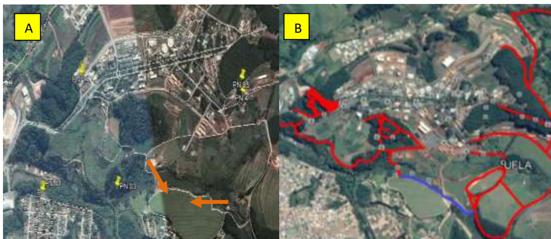
Figura 8. Modificação na trilha das lagoas. A – trilha anos atrás (Google Earth). B – trilha atualmente.