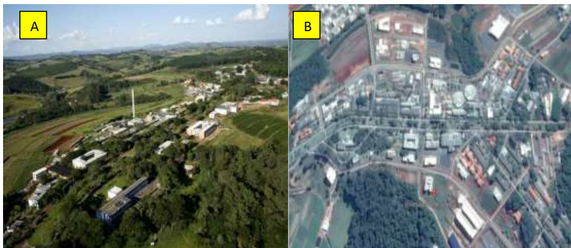
Figura 7. Modificações ocorridas pela construção das avenidas norte e sul. A - UFLA em 2005 (Google). B - UFLA, 2017.

Modernas estruturas arquitetônicas foram edificadas e continuam sendo construídas. Talvez uma das maiores mudanças feitas na Universidade foi a duplicação da avenida de acesso ao campus novo, e a criação das avenidas norte e sul. Com essas modificações muitas trilhas tiveram uma diminuição de sua extensão e algumas desapareceram. A Figura 7A mostra como era a universidade antes da construção das avenidas norte e sul e na Figura 7B pode-se observar como essas construções modificaram as áreas no decorrer dos anos.