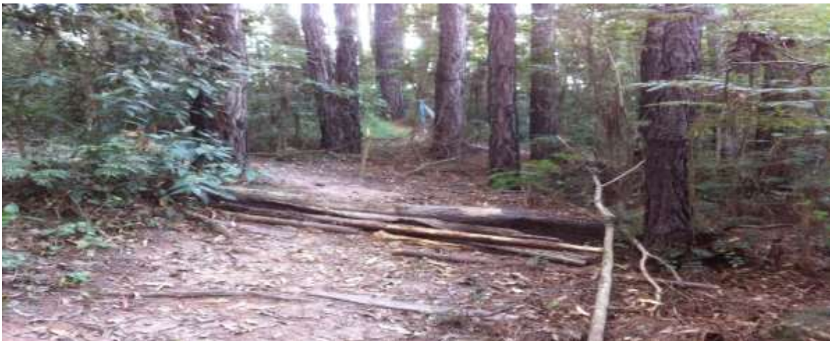
Figura 10. Trilha da UFLA.