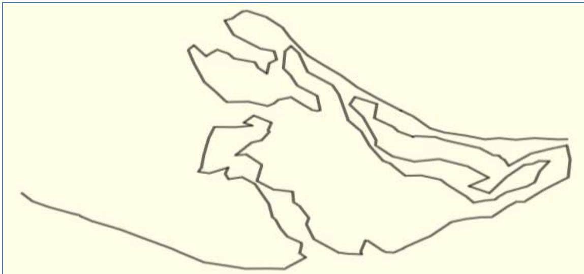
Figura 6. Trilha dos Eucaliptos.