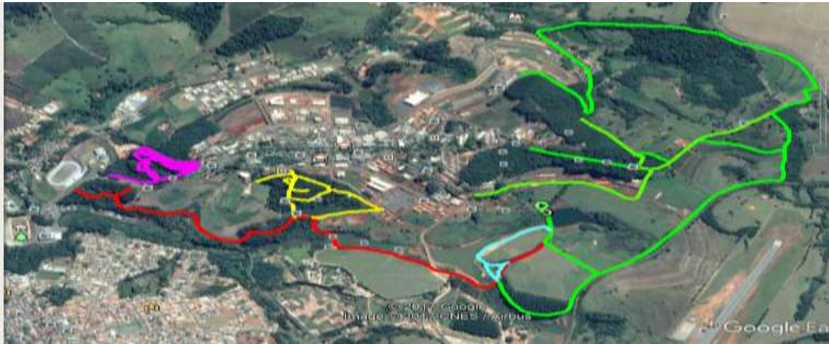
Figura 9. Mapa da UFLA apresentado nas escolas.