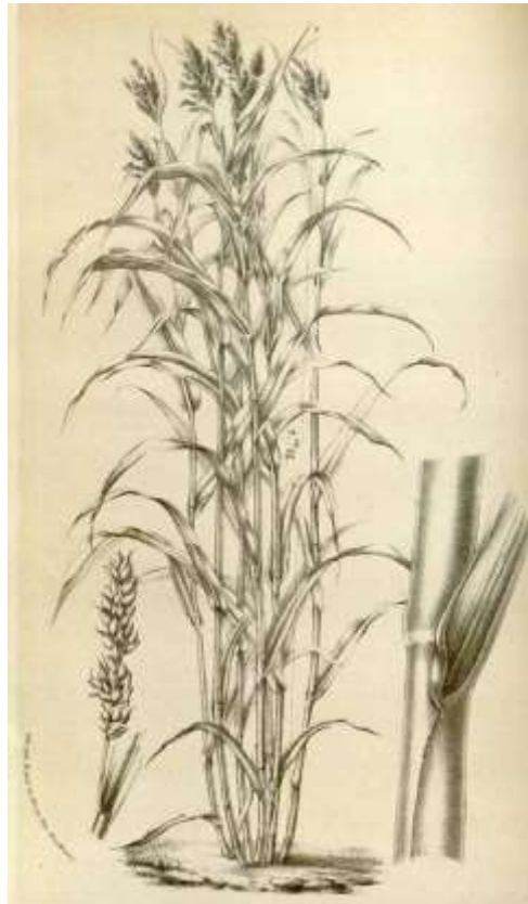
Figura 2. Espécie Sorghum bicolor (L.) Moench.