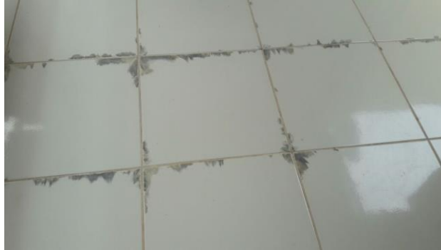
Figura 9 – Manchas nas extremidades da placa cerâmica.