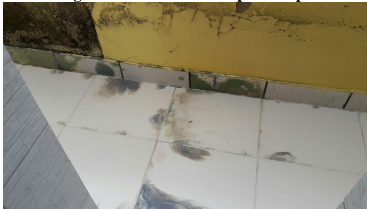
Figura 10 – Manchas nas placas e paredes.