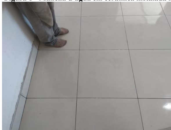
Figura 8 - Mancha d'água em cerâmica instalada na sala.