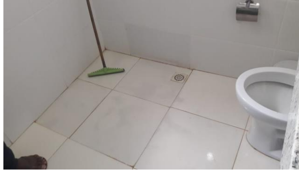
Figura 7 – Mancha d'água em cerâmica instalada no banheiro.