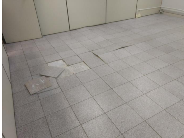
Figura 11 – Destacamento de placa cerâmica.