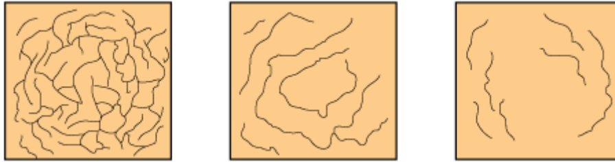
Figura 6 – Gretamento.