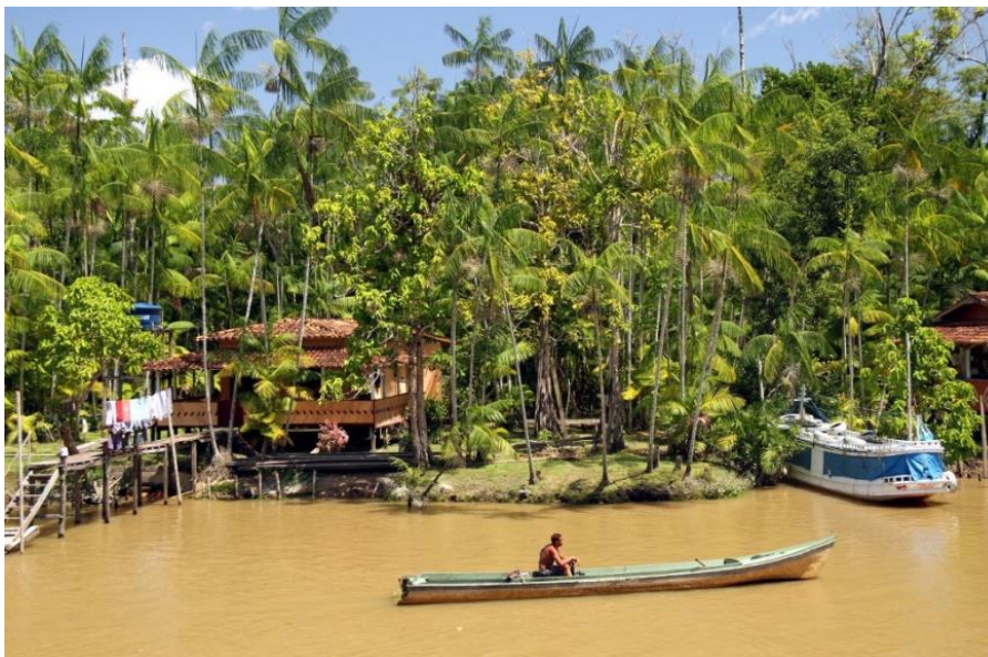
Figura 5 - Ribeirinhos.