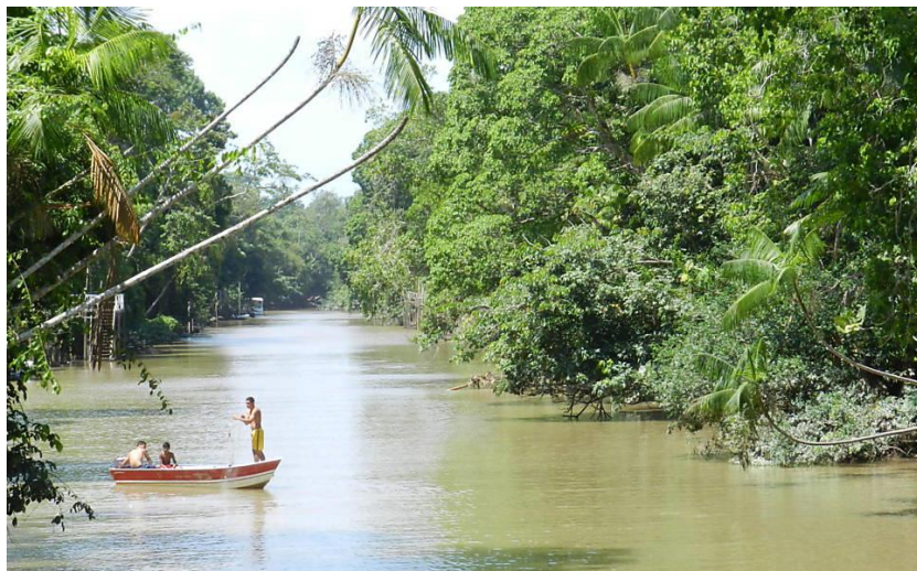
Figura 3 - Ribeirinhos.