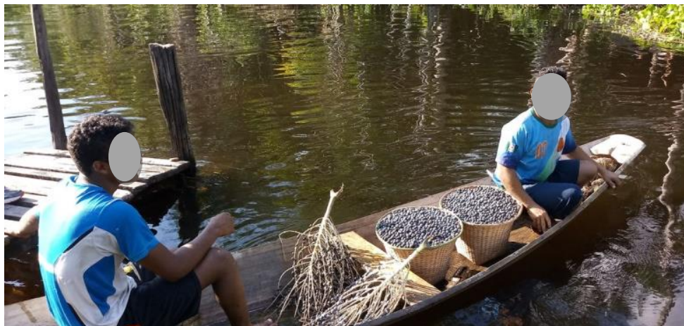
Figura 1 - Ribeirinhos.