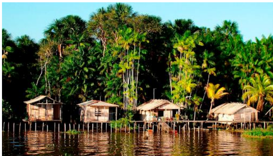
Figura 2 - Palafitas nas margens dos rios.