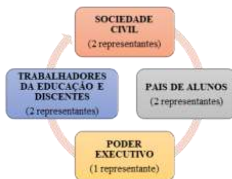
Figura 1 - Composição do CAE.

Fonte: art. 34 da Resolução CD/FNDE nº 26/2013.