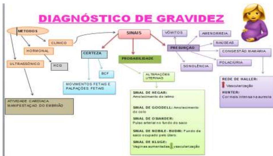
Figura 3 - Flash card da disciplina Atenção Integral a Saúde da Mulher I.

Ainda seguindo com o uso do flash card , a Figura 3 traz mais um modelo que foi associado com a prática de mapas mentais, e o uso dessas duas ferramentas só vem a contribuir, facilitando o aprendizado de conteúdos mais extensos.