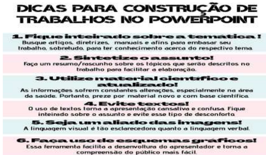
Figura 6 - Cartaz educativo.