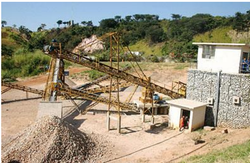
Figura 3 Estação de reciclagem de entulho da Prefeitura de Belo Horizonte

Existem duas formas para se iniciar o reaproveitamento dos materiais. A primeira forma é estabelecer uma unidade de separação e tratamento no canteiro de obra, sendo necessário obter equipamentos móveis para se fazer a moagem e separação granulométrica. Uma opção viável em obras de grande porte, que tenha um volume elevado de produção de resíduo e que tenha bastante espaço no canteiro de obra para instalação da unidade de separação e tratamento. Outro modo são as usinas de reciclagem onde é realizado a triagem e a melhoria do material.