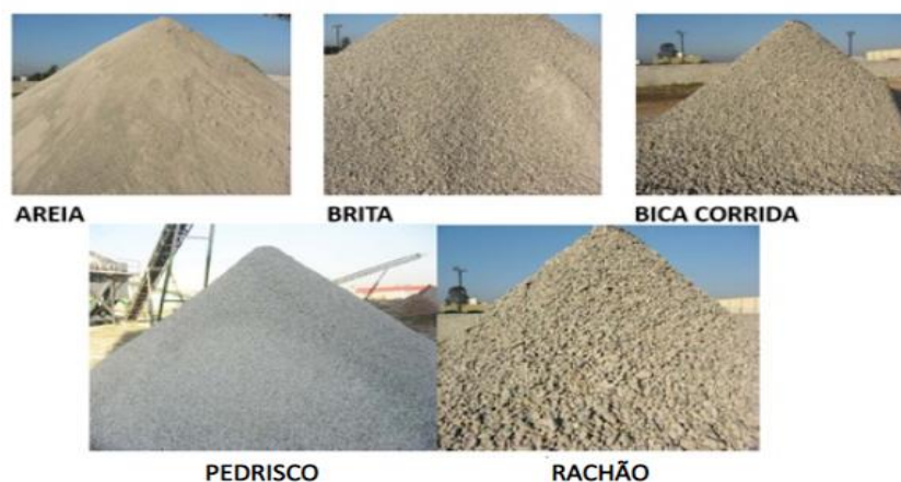
Figura 4 - Produtos reciclados