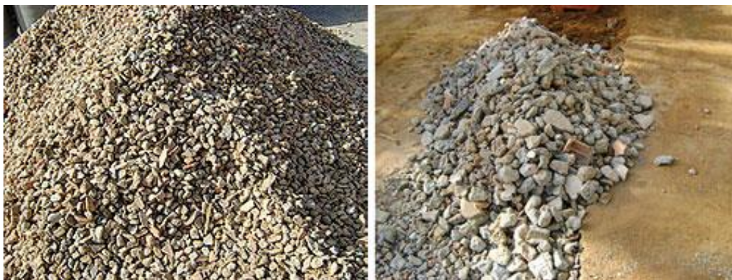
Figura 1- Agregados de entulho, após de reciclados

Assim conseguimos obter o material reciclado, fazendo o uso deste processo nos resíduos será possível distinguir sua composição. O resíduo que é considerado inutilizado é destinado para aterros regulamentados.