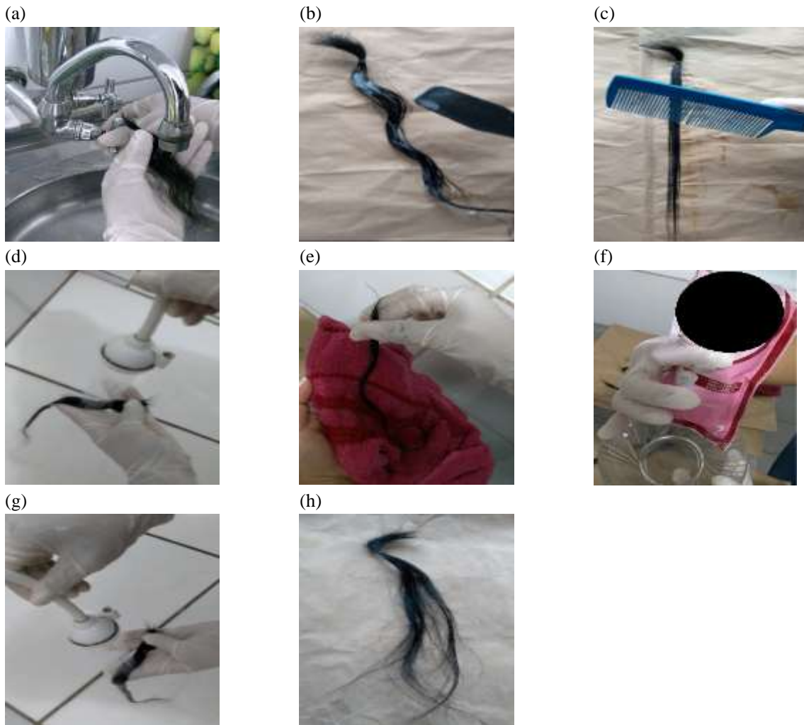
Figura 1 - (a) Alisamento com tioglicolato; (b) Umedecer o cabelo; (c) Passar o pente de plástico; (d) Retirar o creme alisante; (e) enxugar cuidadosamente o cabelo; (f) aplicar a loção neutralizante; (g) Retirar a loção neutralizante; (h) aguardar a secagem naturalmente.

aguardar 20 min (Figura 1c) e no 4 retirar o creme alisante com água morna (Figura 1d). O passo 5 é enxugar cuidadosamente o cabelo (Figura 1e) e o passo 6 aplicar a loção neutralizante e aguardar 10 minutos (Figura 1f). Passo 7 e 8 Retirar a loção neutralizante (Figura 1g) e aguardar a secagem do cabelo naturalmente (Figura 1h).