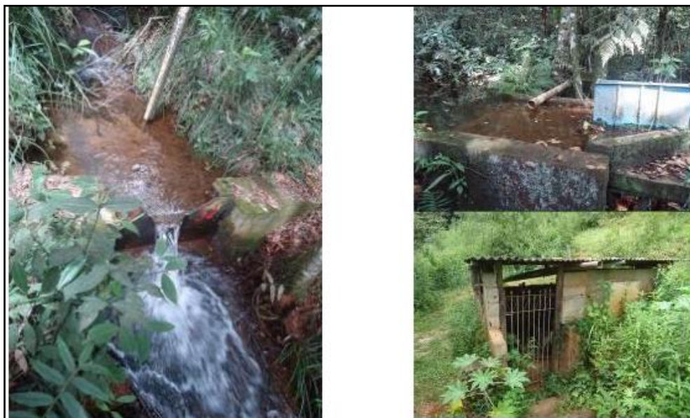
Figura 3: Ponto de captação de água da Nascente dos Gralhos