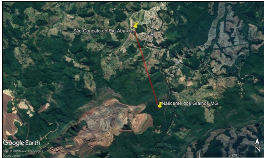
Figura 2: Ponto de captação na Serra do Brucutu-MG

com o possível rebaixamento do lençol freático, implicando na real importância em obter uma segunda alternativa de manancial para captação.