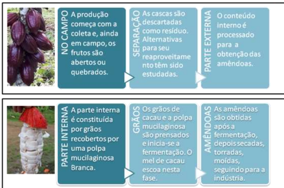
Figura 2 - Processamento do cacau para obtenção das amêndoas secas e do subproduto mel de cacau.

final para fins industriais (Freire et al.,1990). Outro método de extração da polpa utiliza despoldadeira combinada com pulverização de enzimas pectolíticas na concentração de 0,2%, ocorrendo diminuição da viscosidade foi reduzida e aumento do rendimento devido à quebra da pectina, além de aumento da concentração dos açúcares (Freire et al., 1990).