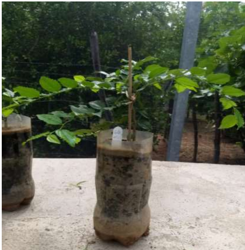
Figura 2. Minicepa de Sarcomphalus joazeiro (Mart.) Hauenschild antes da remoção dos ramos para a quantificação do número de miniestacas possíveis de serem obtidas.