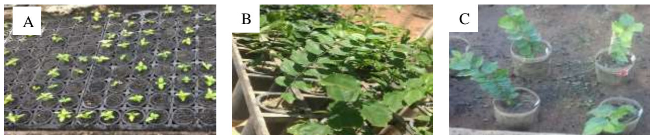
Figura 1. Mudanças de Sarcomphalus joazeiro (Mart.) Hauenschild (Juazeiro) aos 30 dias (A) e aos 105 dias (B) antes do transplante e, aos 112 dias após o transplante (C), quando foi iniciada a decape para a formação das minicepas do minijardim clonal experimental.

Na Figura 1 são apresentadas imagens das mudas aos 30 dias (A) e aos 105 dias (B) antes do transplante e, aos 112 dias após o transplante (C), quando foi iniciada a decape para a formação das minicepas do minijardim clonal experimental.