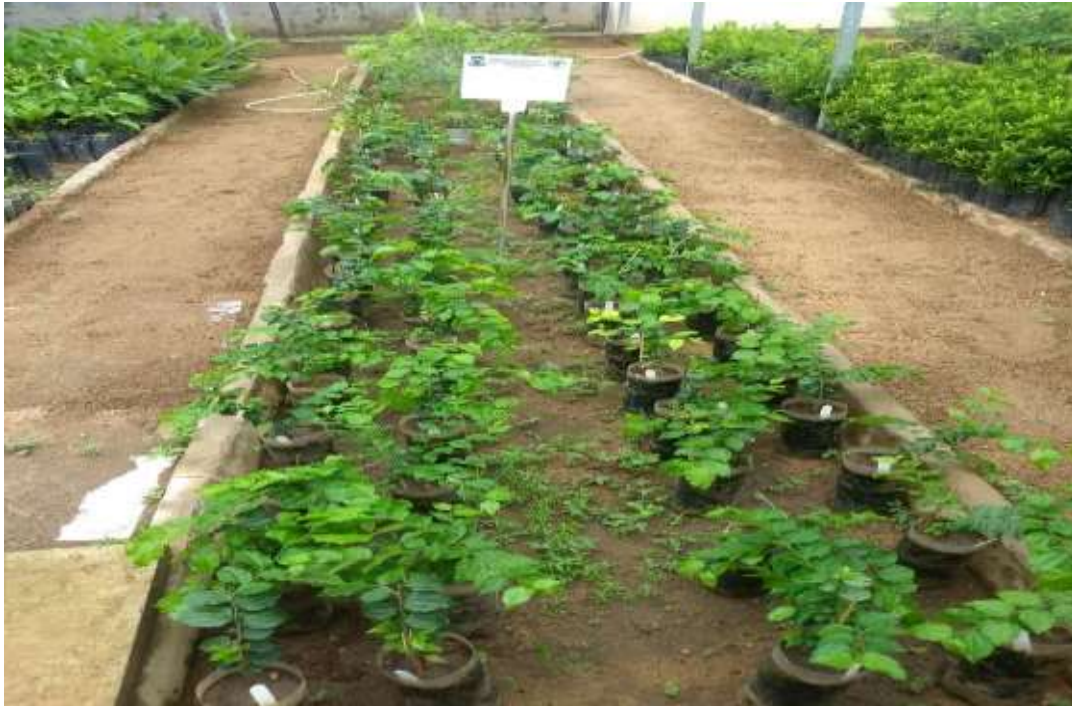
Figura 3. Mini jardim clonal experimental de Sarcomphalus joazeiro (Mart.) Hauenschild, composto por 48 minicepas.