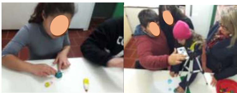
Figura 3 – Criação dos personagens e captura de fotografias para o vídeo.

Foram três encontros, no mês de julho de 2018, sob a orientação da pesquisadora, as educadoras em conjunto com suas turmas e os educandos do turno oposto que estavam presentes, desenvolveram a tarefa, uma animação para o projeto “Descarte Consciente - Planeta Contente”. A técnica utilizada foi o Stop Motion, com uma música cantada pelos educandos das turmas do pré e do primeiro ano. O Stop Motion foi representado de forma animada, na qual o planeta não ficará feliz se não cuidarmos dele, misturando óleo e água, remetendo ao tema do projeto, óleo e água não se misturam. A letra da música foi criada pelas educadoras com suas turmas durante suas aulas. Os personagens confeccionados pelos educandos no turno oposto que estavam presentes, feitos com massinha de modelar, representando a letra da música. Após, os educandos que haviam participado da primeira etapa de oficinas, observados pelas educadoras e com auxílio e orientação da pesquisadora criaram o cenário e tiraram as fotografias para a produção da animação, concluindo, exportaram as imagens registradas para o software de edição, onde foi realizada a edição do vídeo, tendo cuidado com a sequência das fotografias, inserção de imagens, texto, efeitos e áudio, conforme mostra na Figura 3.