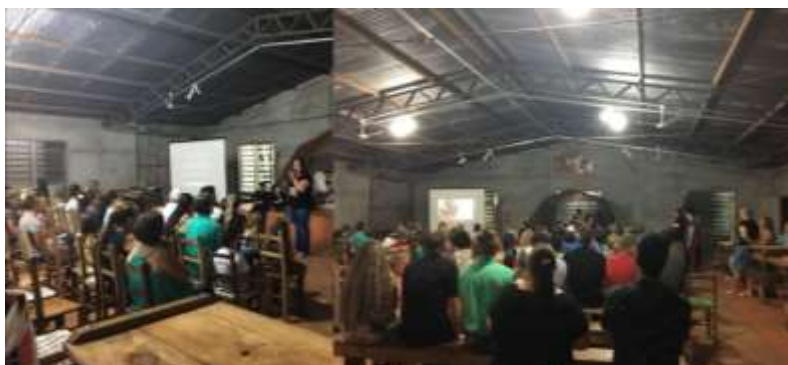
Figura 2 – Socialização do projeto e dos vídeos de Stop Motion.