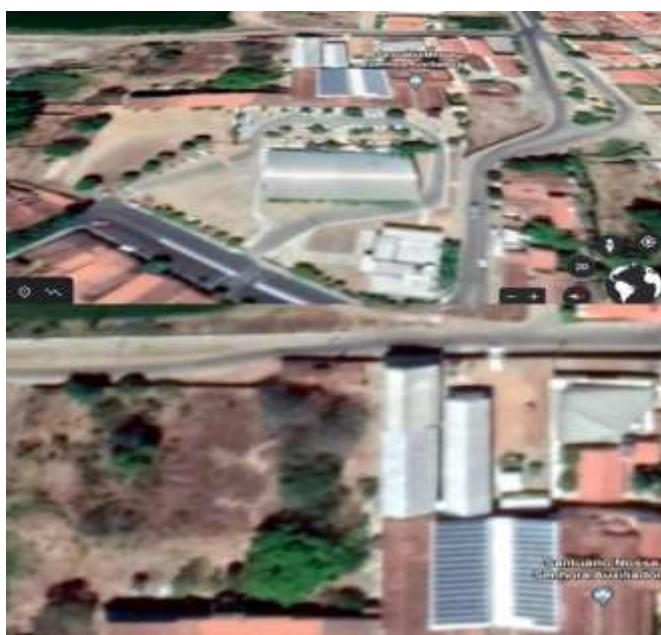
Figura 1 – Foto via satélite do teto da Instituição depois da aplicação dos painéis

No caso estudado os painéis foram instalados nos telhados visto ser uma área grande e com boa inclinação para o sol como mostra a figura 01 logo abaixo.