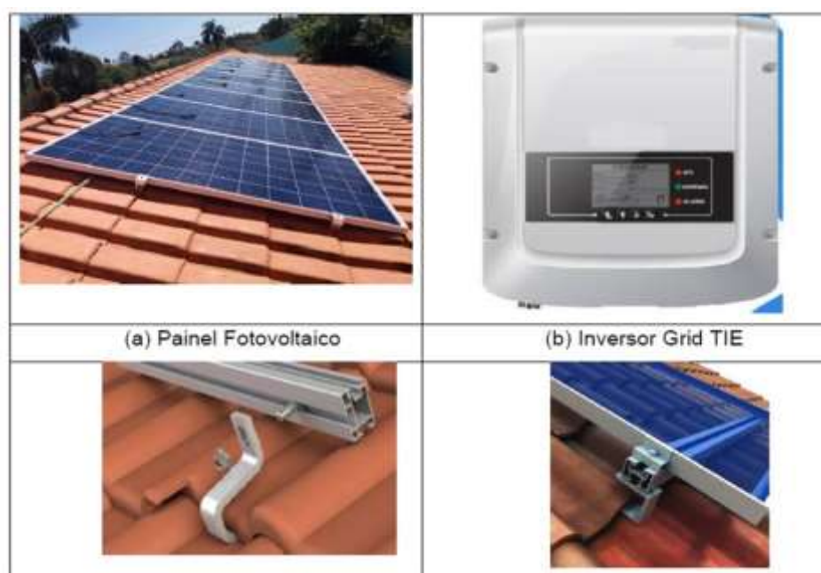
Figura 2 – Foto via satélite do teto da Instituição depois da aplicação dos painéis.

Basicamente, o sistema é formado por painéis fotovoltaicos, inversor grid TIE e fixadores das placas para o telhado. Inversores Grid Tie são inversores de corrente utilizados pelo sistema. Os inversores são capazes de fazer uma sincronização entre o sistema e a rede pública de eletricidade, garantindo que a energia gerada seja fornecida exatamente como aquela que usualmente recebemos da rede elétrica convencional.