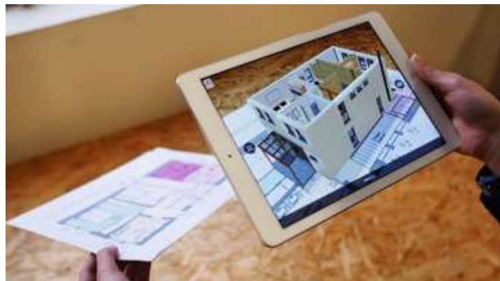
Figura 1: exemplo de utilização da RA no projeto arquitetônico

Para acessar os elementos de RA, é preciso um software específico, permitindo a câmera de um aparelho (celular ou tablet ) realizar a leitura de um marcador (uma espécie de código padronizado – QR Code ) e projetar, em seguida, as informações virtuais associadas aos elementos reais expostos pela própria câmera. A Figura 1 exemplifica a utilização desta tecnologia.