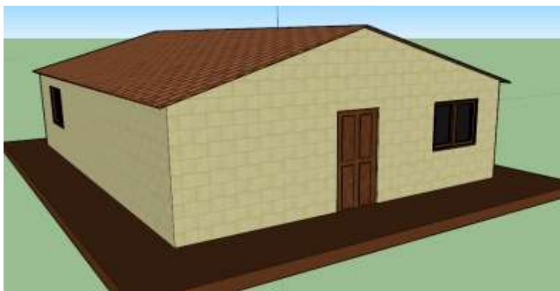
Figura 4: modelo tridimensional desenvolvido pelos participantes através do Sketchup®.