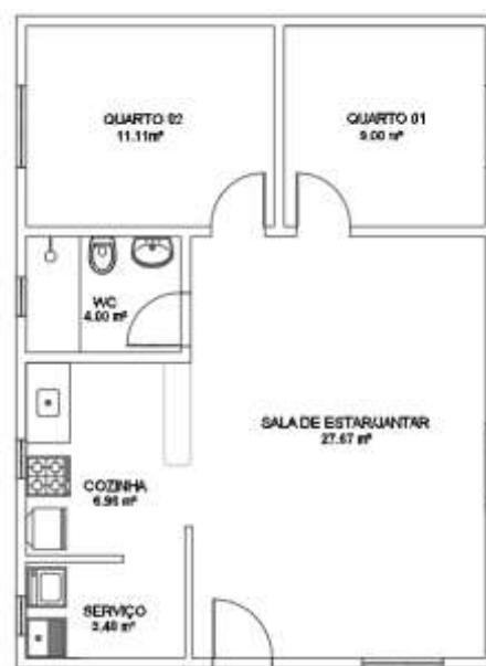
Figura 2: Planta baixa desenvolvida através do Autocad®.