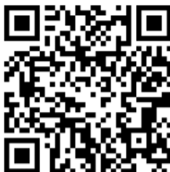
Figura 5: Exemplo de marcador padronizado Augin®.

Com o término da modelagem tridimensional, os alunos foram orientados a utilizar o aplicativo de RA denominado Augin® para inserir a edificação e ter a possibilidade de visualizá-la de modo interativo e portátil. Para isso, o primeiro passo foi realizar a instalação do aplicativo, que é disponibilizado de forma gratuita, através das plataformas Google Play Store e Apple Store. Em seguida, eles inseriram o modelo em suas contas criadas no software , possibilitando a visualização em RA da residência, por meio de um marcador, em que o usuário apontaria a câmera do seu dispositivo, gerando a projeção. A Figura 5 indica a forma apresentada pelo marcador padronizado.