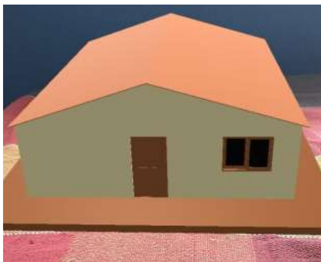
Figura 6: Imagem apresentada pelo dispositivo, por meio do apontamento da câmera para o marcador de RA.

configuração, o giroscópio 2 , tornou possível a projeção do modelo apenas definindo uma superfície plana, sem a obrigatoriedade da utilização do marcador. A Figura 6 a seguir ilustra como a edificação foi gerada pelo aplicativo, e projetada na tela do dispositivo utilizado: