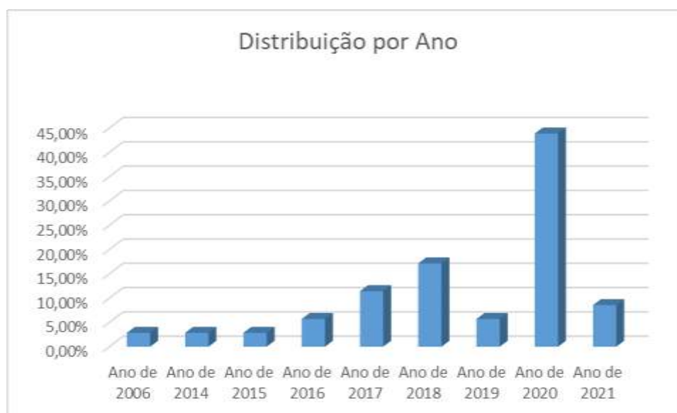
Figura. 1. Levantamento bibliográfico de artigos com desenvolvimento de novos produtos à base de Kefir no período de 2006 a 2021.

Conforme o levantamento dos artigos, foi possível verificar que houve um aumento de artigos publicados com desenvolvimento de novos produtos à base de Kefir no ano de 2020 (Figura 1).