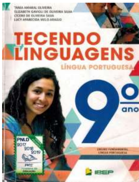
Figura 1 – Capa do livro didático “Tecendo Linguagens”.