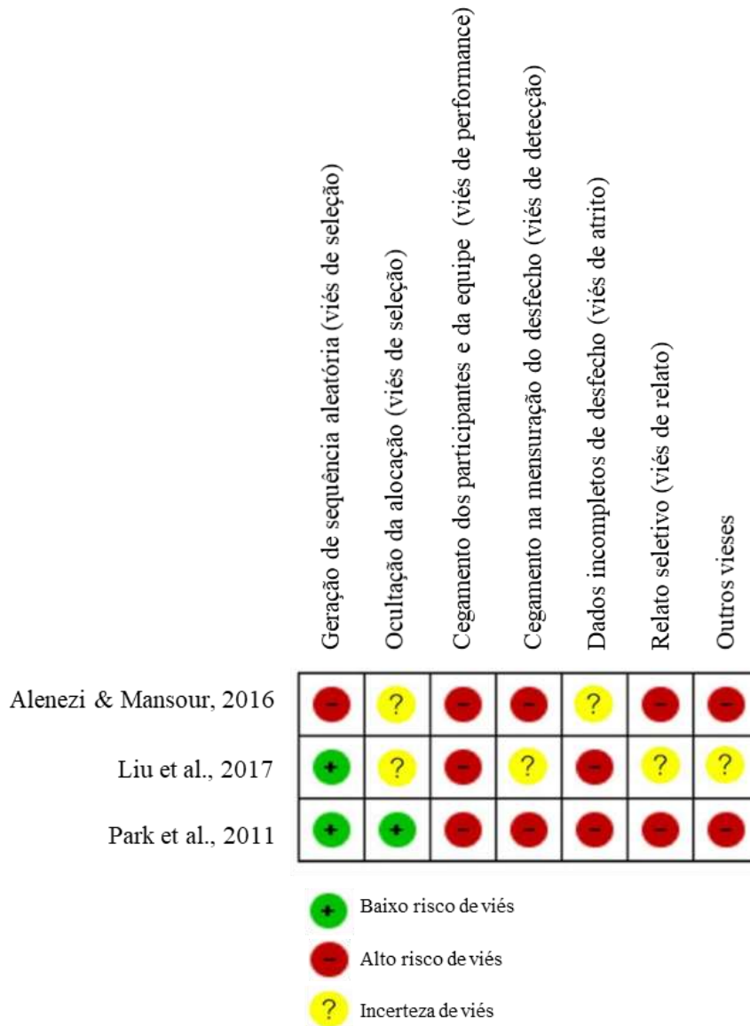
Figura 2. Avaliação individual do risco de viés.

A avaliação do risco de viés seguiu o método padronizado pela Cochrane e está representada nas Figuras 2 e 3.