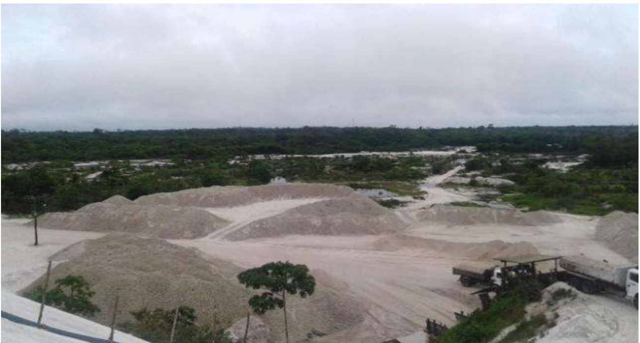
Figura 2: Vista aérea de uma área abandonada depois da exploração do minério de seixo no município de Ourém.

A vegetação secundária que surge após a retirada da floresta nativa, caracterizada pela fase de pousio, tem importância prática para o ambiente. A biomassa vegetal acumula nutrientes que é posteriormente decomposta por fungos e bactérias. Entretanto, em locais de alta degradação, comumente recorrente da mineração, estes ambientes ficam abandonados após sua exploração, sem a intervenção adequada o solo encontra dificuldades para a recuperação de sua fertilidade (Figura 2).