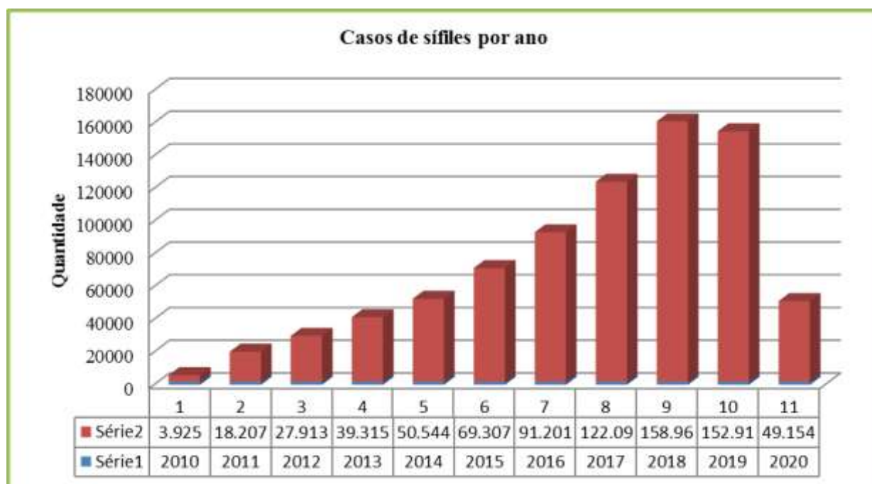
Gráfico 1. Casos e taxa de detecção (por 100.000 habitantes) de sífilis adquirida por ano de diagnóstico. Brasil, 2010-2020.

Notas: (1) Dados até 30/06/2020; (2) Dados preliminares para os últimos 5 anos. Fonte: MS/SVS/Departamento de Doenças de Condições Crônicas e Infecções Sexualmente Transmissíveis. Fonte: Autores.