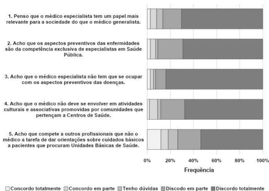
Figura 1. Distribuição dos estudantes quanto a concordância com os itens de sentido negativo no contexto da importância dada ao médico generalista e a atuação médica geral. Belém, 2019.

p < 0,0001 (Qui-Quadrado de aderência).