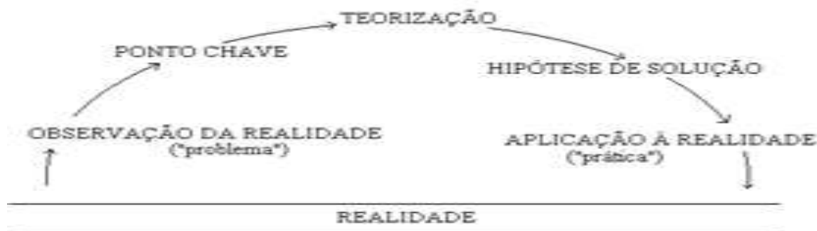
Figura 5 – Método do arco.