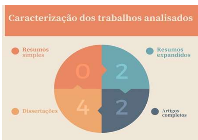
Figura 1: Quantidade de trabalhos selecionados de acordo com os critérios da pesquisa.

As palavras-chaves utilizadas para a seleção dos trabalhos analisados foram: “ bullying ”, “ violência escolar ” e “ conflitos ”. Após selecionados, os trabalhos foram classificados em resumos expandidos, artigos completos ou dissertações de mestrado e foram também quantificados o gênero da autoria da pesquisa (masculino ou feminino), (gráfico 1). Na figura 1, ilustramos de forma didática a caracterização dos manuscritos analisados.