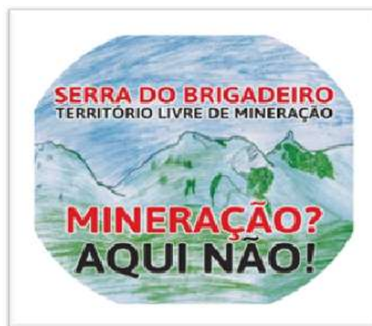
Figura 3. Resistência à Mineração na Serra do Brigadeiro.

Os coletivos de resistência e mobilização popular tem solidificado sua articulação regional, com a realização de importantes atos de enfrentamento à atividade extrativa, o que corrobora para que o lema de “Serra do Brigadeiro, Território Livre de Mineração: Mineração? Aqui não” ganhe evidência regional e simbolize de forma muito marcante a importância da mobilização popular e do apoio de movimentos sociais, projetos de extensão universitária, dentre outros atores de suma importância para esse processo de construção de uma frente de resistência coletiva que inspira outras regiões que podem estar inseridas no âmbito de conflitos ambientais dessa natureza. A exemplo da promoção da “Carreata contra a Mineração, em defesa da Serra do Brigadeiro” organizada pela Comissão Regional de Enfrentamento à Mineração na Serra do Brigadeiro, ocorrida em 26/06/2021 na cidade de Rosário da Limeira-MG, com o lema “Mineração Aqui Não” conforme pode-se observar na Figura 3 o emblema da campanha.