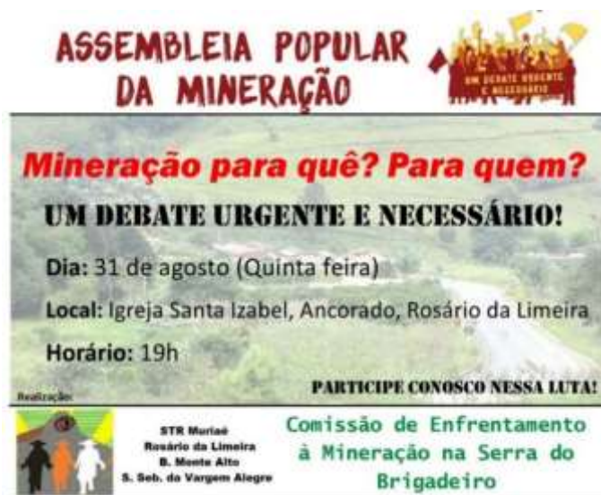
Figura 2. Cartaz de mobilização para realização de reunião em Rosário da Limeira