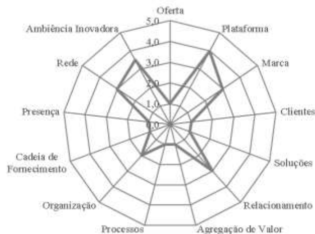
Figura 2. Radar da Inovação da Associação de Catadoras de Mangaba do Litoral Sul-1,

Com relação aos resultados da aplicação do Radar da Inovação, as ações desenvolvidas nos últimos três anos conferem à Associação de Catadoras de Mangaba do Litoral Sul-1, fundada no ano de 2010, a categoria de empreendimento “Pouco ou nada inovadora”, com maiores pontuações nas dimensões plataforma, marca, relacionamento, rede e ambiência inovadora (Figura 2). Por destaques, verificou-se que esta associação desenvolveu 04 (quatro) marcas comerciais, possui 02 (dois) sites e 01 (um) perfil no instagram, os quais são as principais interfaces de comunicação junto aos clientes e parceiros. Em contrapartida, verificou-se que esta associação, todavia, não se consolidou comercialmente, porém apresenta relevantes ações e projetos voltados às capacitações técnicas e formações para o trabalho junto às comunidades das regiões de restinga e dos tabuleiros costeiros do litoral do Estado de Sergipe.