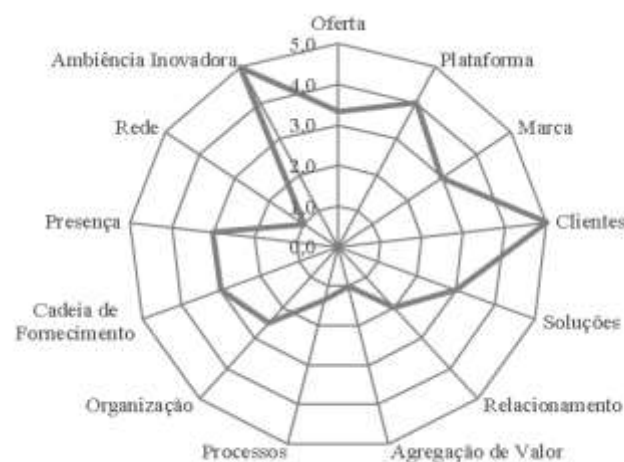
Figura 5. Radar da inovação da Associação de Catadoras de Mangaba Litoral Norte-2.

Entretanto, apesar dos resultados positivos em decorrência das estratégias comerciais, a análise das ações desenvolvidas nos últimos 03 (três) anos através da aplicação do Radar da Inovação classificou a Associação das Catadoras de Mangaba Litoral Norte-2 como um empreendimento “Pouco ou nada inovador”, com maiores pontuações nas dimensões clientes, plataforma, cadeia de fornecimento, presença e ambiência inovadora (Figura 5).