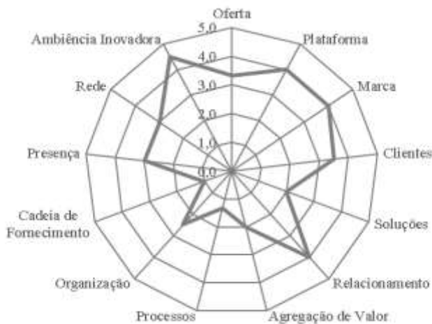
Figura 4. Radar da Inovação da Associação de Catadoras de Mangaba Litoral Norte-1.

A Associação das Catadoras de Mangaba do Litoral Norte-1, fundada no ano de 2010, atualmente possui a infraestrutura mais completa e apresentou elevada pré-disposição em inovação de aspectos relacionadas às dimensões plataforma e marca. Sua infraestrutura possibilita, além das atividades produtivas e administrativas, realizações de eventos, cursos e alojamentos para visitantes, técnicos e turistas. Em razão de sua localização mais próxima à região metropolitana, verifica-se que a maior intensidade comercial desta região favorece a identificação de uma maior diversidade de oportunidades de mercado, o que provoca pressões por ações de inovação a fim de atender suas condições de acesso ou de implementar aprimoramento ou novidades. Apesar das maiores possibilidades em relação ao uso de infraestrutura, a avaliação das ações de inovação dos últimos 03 (três) anos a classificam como “Pouco ou nada inovadora” obtendo maiores pontuações nas dimensões plataforma, marca, relacionamento e ambiência inovadora (Figura 4).