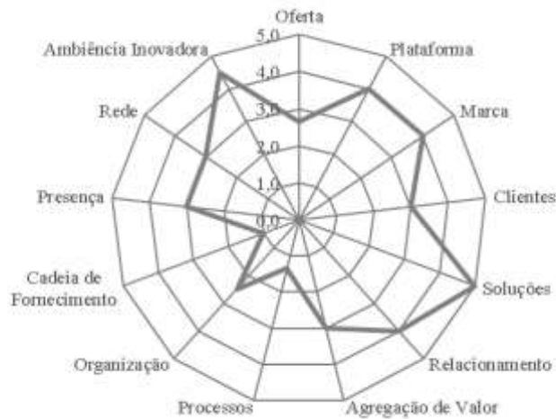
Figura 3. Radar da Inovação da Associação de Catadoras de Mangaba Litoral Sul-2.