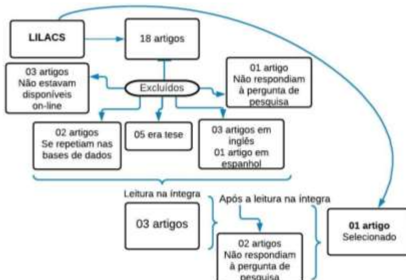
Figura 1: Fluxograma referente as buscas pelas produções.

A busca pelas produções, representada na Figura 1, resultou na seleção de 05 artigos. Reescrever a oração anterior. Por fim, a partir do estabelecimento dos critérios de inclusão e exclusão, o corpus do estudo foi constituído de 05 artigos.