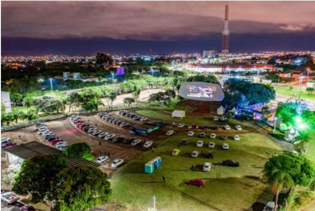
Figura 1. Vista aérea do AutoCine UFMS.