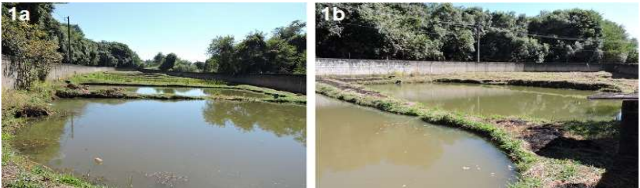
Figura 1. Tanques escavados de piscicultura da Universidade José do Rosário Vellano onde houveram às coletas dos gêneros de Odonata entre os meses de outubro/2018 a março/2019. 1a: Vista da entrada 1b: Vista lateral.