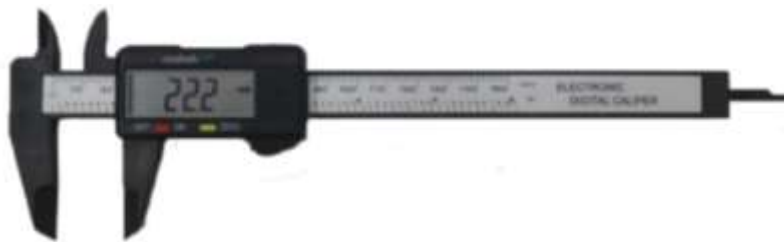
Figura 4 – Paquímetro.