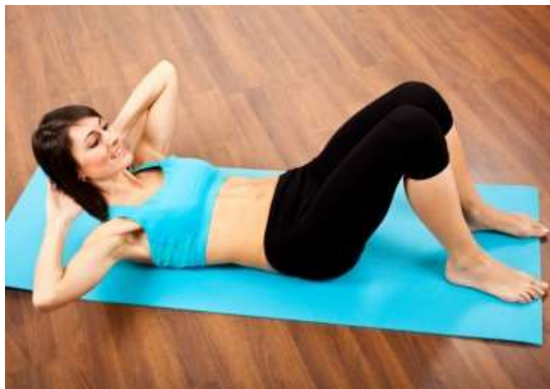
Figura 6 – Fortalecimento da musculatura abdominal.