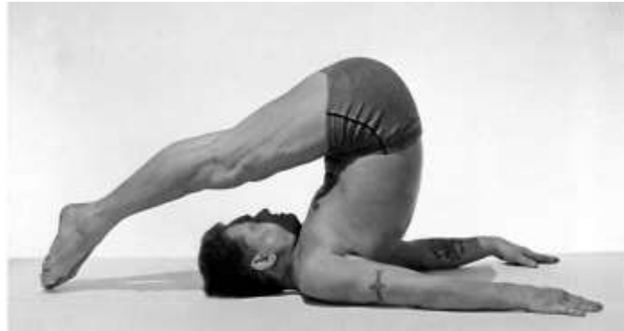
Figura 5 – Joseph Pilates realizando o movimento roll-over de seu método.