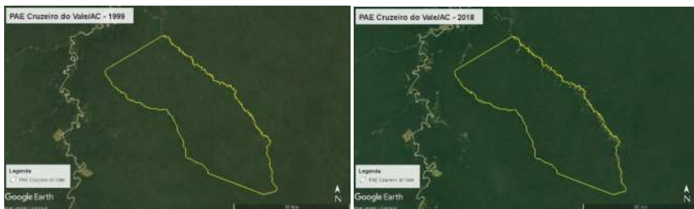
Figura 5. PAE Cruzeiro do Vale, AC, Brasil, 1999 y 2018.