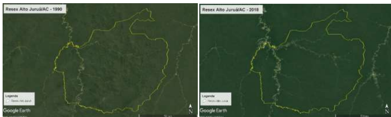
Figura 7. Resex Alto Juruá, AC, Brasil, 1990 y 2018.