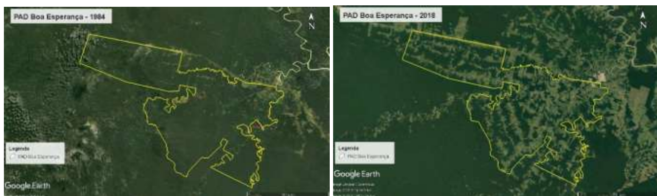
Figura 3. PAD Boa Esperança, AC, Brasil, 1984 y 2018.