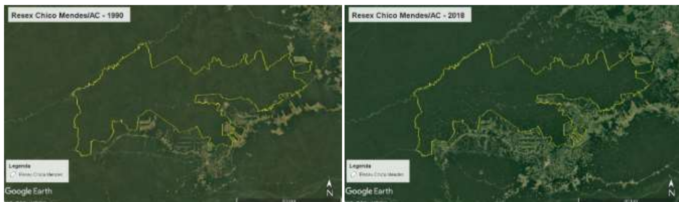
Figura 8. Resex Chico Mendes, AC, Brasil, 1990 y 2018.