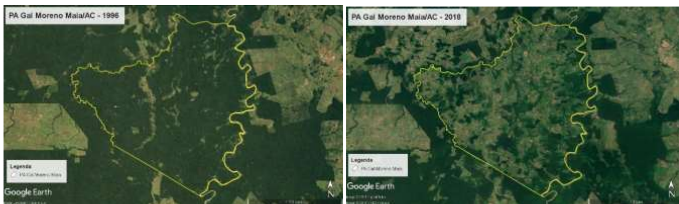
Figura 4. PA Gal Moreno Maia, AC, Brasil, 1996 y 2018.