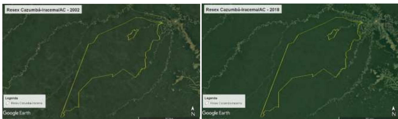
Figura 9. Resex Cazumbá-Iracema, AC, Brasil, 2002 e 2018.