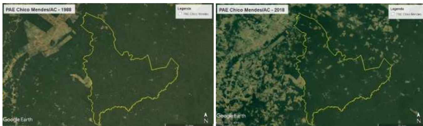
Figura 6. PAE Chico Mendes, AC, Brasil, 1988 y 2018.