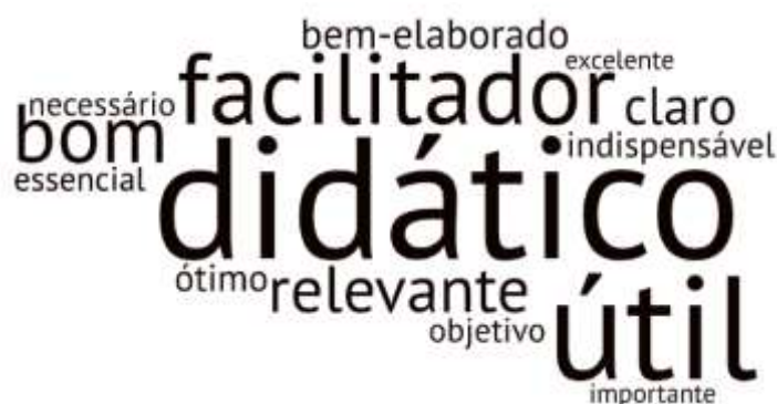
Figura 3 - Adjetivações atribuídas ao roteiro de autoestudo pelos alunos.

Os enunciados de (23) a (29) corroboram a avaliação positiva depreendida nas análises anteriores, além de validar uma prática passível de replicação em outros contextos. A validação da eficácia do roteiro de autoestudo pode, ainda, ser sintetizada pela adjetivação recorrente do recurso, sintetizada na nuvem de palavras da Figura 3, a seguir, a partir de dados coletados diretamente das enunciações dos alunos: