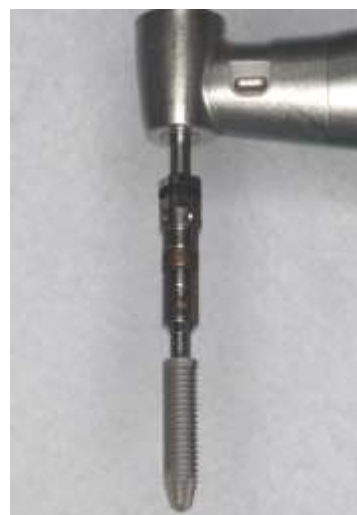
Figura 11 – Implante utilizado IntraOss Titaoss