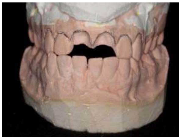
Figura 3 – Modelo de gesso simulando exodontia atraumática vista vestibular.