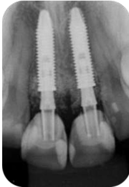
Figura 22 – Radiografia periapical com preservação de 06 meses.