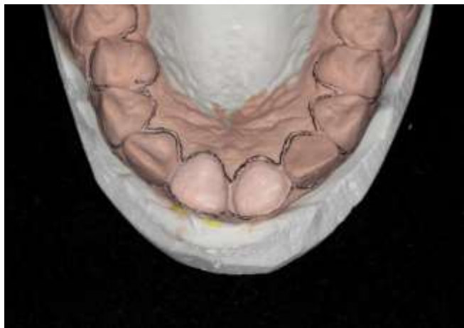
Figura 2 – Modelo de gesso inicial demarcando contorno gengival.

Diante da primeira consulta foi realizado a remoção do aparelho ortodôntico existente, bem como exames iniciais de raio x odontológicos, seguido da confecção de três modelos de gesso que possuíam os objetivos de auxiliar a parte inicial do planejamento (Figuras 2, 3 e 4).