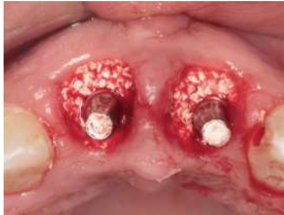
Figura 16 – Adaptação do enxerto xenógeno para preenchimento dos gap's.