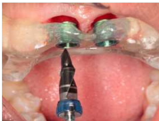
Figura 10 – Guia cirúrgica em posição

A guia cirúrgica foi colocada novamente em posição e seguiu-se com a sequência de fresagem Figura 10). O limite de fresagem e de instalação para ambos os dentes correspondeu a 25 mm e 11 mm, respectivamente. Os implantes de escolha corresponderam ao tipo cone morse de ápice cônico IntraOss Titaoss CMX Max Implant de 3,75 mm de diâmetro por 15 mm de comprimento (IntraOss, Itaquaquetuba, SP, Brasil) (Figura 11).