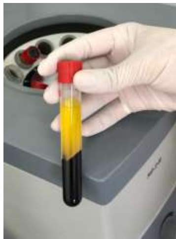
Figura 6 – Obtenção da L-PRF pós centrifugaã

Em seguida foram retirados 4,5 tubos de sangue da paciente com o propósito de se obter a Fibrina Rica em Plaquetas e Leucócitos (L-PRF). Os tubos foram levados para a centrifugação por 12 minutos a 2.750 rotações, separando o plasma com fibrina do sangue (Figura 6). A L-PRF auxilia no processo de cicatrização.