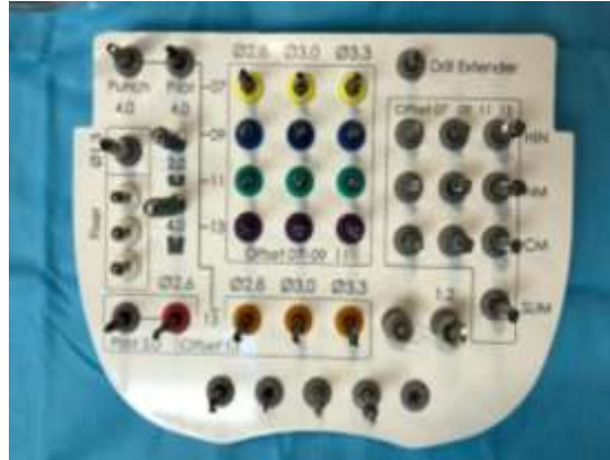
Figura 12 – Kit utilizado Smart Guided Kopp.

O protocolo cirúrgico permaneceu de acordo com as orientações expostas pelo fabricante (Kit Smart Guided Kopp, Itaquera, SP, Brasil), seguindo a sequência: broca piloto off set 11; broca off set 11 por 7mm x 2,8 para iniciar a frenagem escalonada; broca off set 11 por 11mm x 2,8; broca off set 11 por 13mm x 2,8; broca off set 11 por 15mm x 2,8 (Figura 12).