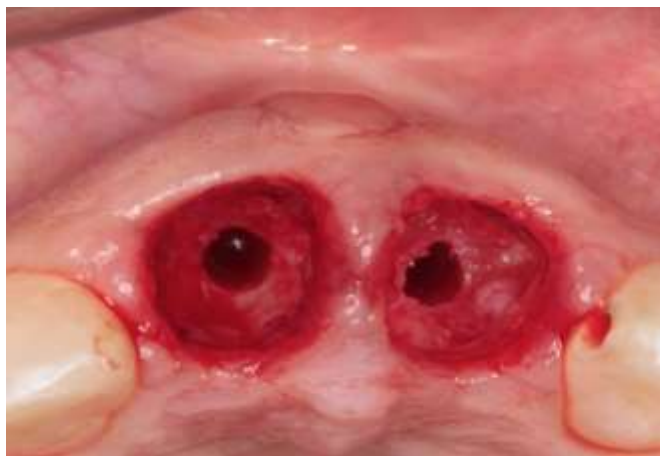
Figura 13 – Aspecto final pós fresagem.

Após finalizar a série de brocas supracitadas para perfuração (figura 13), uma porção de L-PRF foi inserida nos alvéolos com o intuito de aumentar a proliferação de osteoblastos e influenciar de forma benéfica a cicatrização (Figura 14). Em um ato contínuo finalizou-se a instalação dos dois implantes de 3,75x15 com montador guiado no off set 11 com uma velocidade estabelecida de 25 rpm (Dabi Atlante, Ribeirão Preto, SP, Brasil).