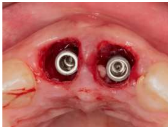
Figura 15 – Presença de gap no alvéolo dos dentes 11 e 21

Ao final desta etapa foi possível identificar a presença de gap com aproximadamente 10 mm (Figura 15), sendo uma consequência da perda óssea. Devido a isso, foi necessário utilizar enxerto ósseo cuidadosamente adaptado entre o osso remanescente e os implantes.