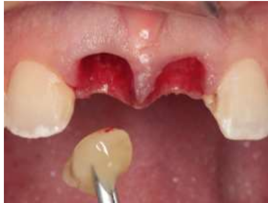
Figura 14 – Inserção da L-PRF no alvéolo pós cirúrgico.