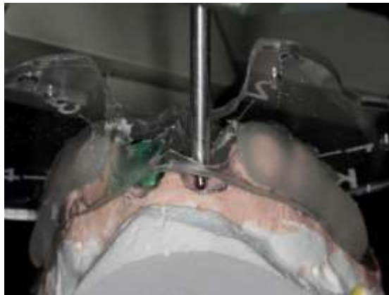
Figura 5 – Confeção da guia tomográfica simulando posição ideal dos implante

Por meio dos modelos de gesso foi possível elaborar uma guia tomográfica que consiste em uma placa de acetato, unida na região correspondente a face oclusal, a um suporte tomográfico (placa base). A guia tomográfica deve apresentar retenção e estabilidade, bem como ausência de báscula (Figura 5). Após a correta instalação e adaptação da guia tomográfica no arco superior da paciente, foi realizado uma nova TC.