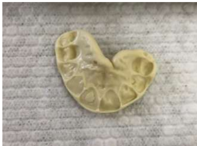
Figura 7 – Muralha de moldagem confeccionada com silicone de condensação.

Na seqüência, foi executado a anestesia dos nervos alveolar superior anterior, nasopalatino e infiltrativa submucosa, utilizando 04 tubetes de anestésico lidocaína 2% com felipressina 1:100.000 (DFL, Rio de Janeiro, RJ, Brasil). Adicionalmente a este processo, confeccionou-se a muralha de moldagem com material silicone de condensação (Coltene, Rio de Janeiro, RJ, Brasil) (Figura 7).