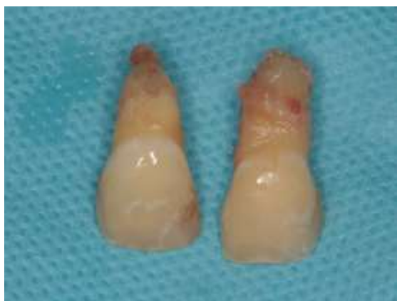
Figura 8 – Elementos dentários 11 e 21 pós exodontia atraumática

Logo após, sucedeu-se a exodontia atraumática dos dentes 11 e 21 visando preservar ao máximo os tecidos moles e ósseos orais, além das papilas dentárias (Figura 8). Ao fim da exodontia observou-se a presença de um cisto no alvéolo do dente 11, prosseguindo então, com a curetagem do alvéolo dental através da cureta de Lucas (Quinelato, Rio Claro, SP, Brasil), removendo assim, todo fragmento que pudesse vir a interferir no processo de cicatrização e osseointegração. Observou-se também a presença de defeito ósseo (Figura 9) e lesão de cárie na face mesial do dente 22, sendo posteriormente restaurado.