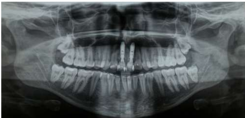
Figura 21 – Radiografia panorâmica com proervação de 06 meses

Em uma nova consulta, após seis meses de proervação, foi realizado novamente todo o protocolo citado anteriormente para higiene da área operada. Houve também a suspensão do uso da placa acrílica e solicitação de uma nova radiografia panorâmica (Figura 21) e periapical (Figura 22) com o objetivo de avaliar a cicatrização óssea do enxerto, na qual constatou-se uma adequada compactação da área enxertada presente até a borda do componente e o osso remanescente. Orientou-se a paciente a procurar um profissional ortodontista para correção discrepância oclusal (mordida topo a topo).