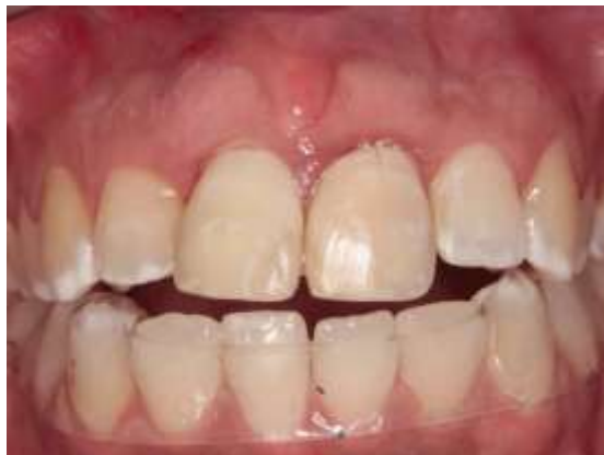
Figura 20 – Pós operatório imediato com a utilização da placa acrílica