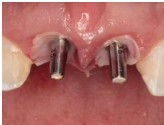
Figura 17 – Segunda adaptação da L-PRF.

Novamente foi utilizado uma nova membrana de L-PRF (Figura 17) com a finalidade de ação como uma barreira biológica, onde visou-se evitar uma possível comunicação entre fluidos provenientes da cavidade oral e coroa com o enxerto ósseo e a área recém operada.