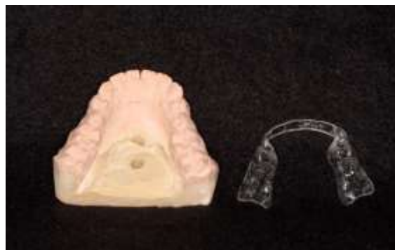
Figura 19 – Placa acrílica confeccionada.

Desgastes na borda incisal dos dois dentes e confecção de uma placa acrílica transparente inferior envolvendo somente os dentes posteriores (Figura 19) foram procedimentos realizados com o objetivo de evitar que a paciente tenha contatos prematuros, impedindo com que cargas sejam distribuídas ao longo dos implantes recém instalados. Vale salientar que a presença de contato dentário nesta fase prejudicaria o processo de cicatrização e o fenômeno de osseointegração.