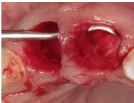
Figura 9 – Alvéolo pós cirúrgico imediato com presença de defeito ósseo