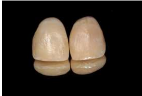
Figura 18 – Componentes protéticos obtidos através dos dentes 11 e 21.