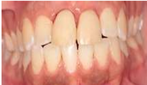
Figura 23 – Pós operatório clínico com preservação de 06 meses.

Na mesma sessão ocorreu a análise clínica dos aspectos pós operatórios, observando-se uma evolução no processo de cicatrização (tecidos moles orais com coloração e aspectos adequados) e osseointegração (Figura 23).