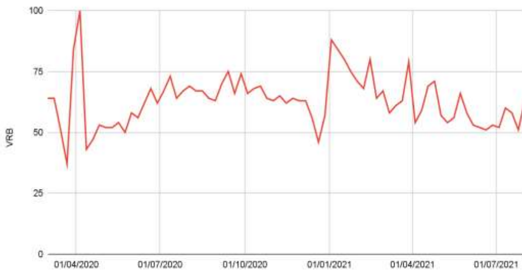
Figura 2. Volume relativo de busca (VRB) por tópicos relativos a jejum entre usuários brasileiros do Google durante a pandemia.