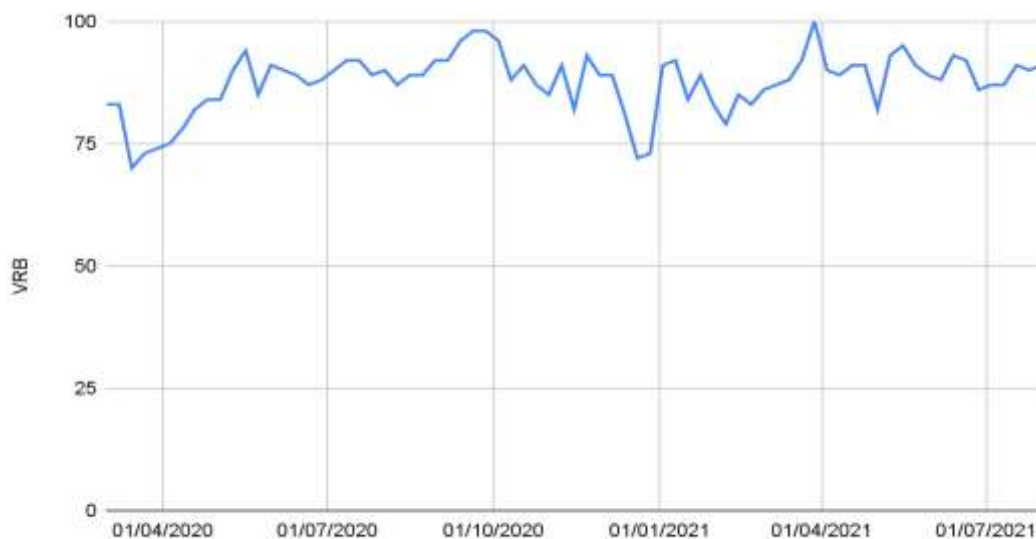
Figura 1. Volume relativo de busca (VRB) por tópicos relativos a peso entre usuários brasileiros do Google durante a pandemia.

As pesquisas semanais relacionadas ao peso mostraram valores ajustados de VRB \geq 70 . Isso indicou alta popularidade do referido termo, refletindo o interesse dos usuários. Os períodos de menor busca ocorreram em meados de março e no final de dezembro/2020, com retomada do interesse e ascensão do VRB no mês de janeiro/2021. Dentre os termos mais buscados, destacam-se produtos de emagrecimento lançados no período, que apresentavam o termo “peso” no nome comercial. As pesquisas estavam relacionadas ao funcionamento e resultados alcançados com o uso desses produtos. O interesse ao longo do tempo relacionado ao peso pode ser visualizado na Figura 1.