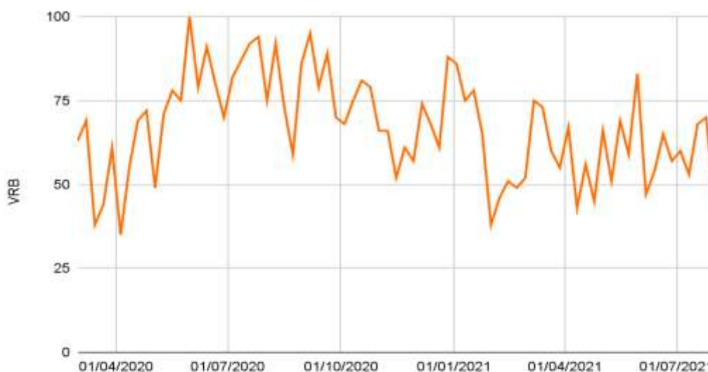
Figura 5. Volume Relativo de Busca (VRB) por tópicos relativos a remédios para emagrecer entre usuários brasileiros do Google durante a pandemia.

As buscas por “remédio para emagrecer” tiveram queda e ascensão repentinos em todos os meses pesquisados. As buscas que mais interessaram os usuários foram por remédios para emagrecer de forma rápida ou até mesmo em uma semana e com baixo custo. Os resultados completos estão dispostos na Figura 5.