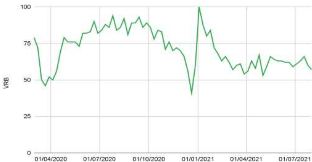
Figura 3. Volume relativo de busca (VRB) por tópicos relativos à dieta entre usuários brasileiros do Google durante a pandemia.

O termo “dieta” apresentou grande interesse do público em todo o período, com aumento em vários momentos, atingindo, inclusive, a popularidade máxima. As pesquisas que apresentaram ascensão foram referentes à dieta low carb, cetogênica e para diabéticos. O menor valor de VRB \leq 41 ocorreu no final de dezembro/2020. É válido destacar o aumento na 1ª semana de janeiro/2021, logo após o menor índice de VRB do período, como mostra a Figura 3.