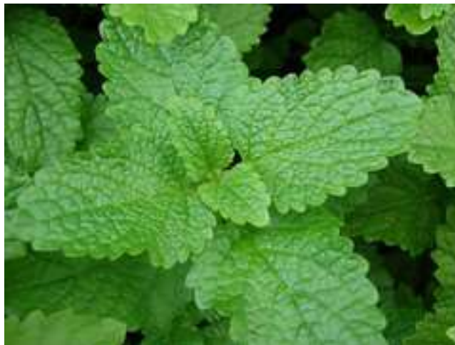
Figura 1. Folhas da Melissa officinalis

folhas são ovais, pecioladas, pelosas, ramificada, com coloração verde escura na face ventral e verde claro na face dorsal (Silva, 2011). A figura a seguir mostra detalhadamente a planta M. officinalis na forma real.