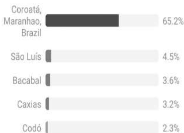
Figura 1 - Principais localidades no estado do Maranhão que acessaram o perfil do projeto.

stories por meio do uso da caixa de perguntas, enquetes e teste foi possível diagnosticar o déficit de conhecimento dos seguidores sobre a temática. Foi realizado 35 posts informativo no feed , distribuídos entre fotos e vídeos. Todas as dúvidas dos seguidores que foram recebidas via direct , foram esclarecidas, permitindo a confidencialidade. O uso das hashtags , como: #sexualidade, #sexualidadenagestão, #sexualidadefeminina, #saudesexual e #saudedamulher #projeto de extensão e o emprego da localidade “UEMA/campus Coroatá-CESCOR”, nos conteúdos digitais funcionaram como filtro e direcionamento para outros usuários da rede social, fazendo com que aumentasse o alcance de público para além dos 262 seguidores, para também 1125 não seguidores consequentemente possibilitando que obtivessem acesso ao conteúdo, e com isso também foi ampliado a localidade de acesso (Figura 1).