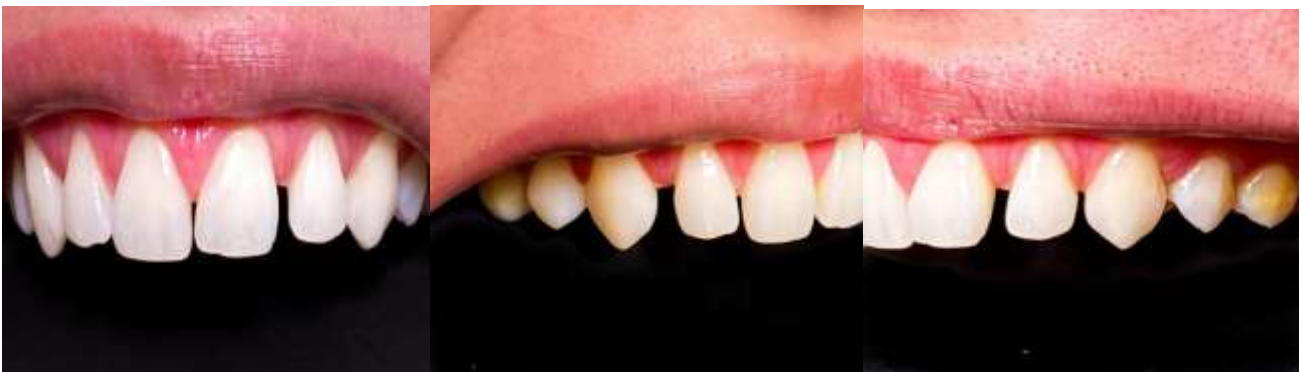
Figura 1 - A) Foto inicial intraoral dos elementos; B) Foto inicial intraoral vista lateral direita; C: Foto inicial intraoral vista lateral esquerda.

Paciente do gênero feminino, 23 anos, compareceu à Clínica Odontológica do Centro Universitário FAMETRO, apresentando como queixa principal “Insatisfação devido ao espaço entre os dentes anteriores e tamanhos desproporcionais”. Durante a anamnese não foram relatados problemas de saúde ou alterações sistêmicas. Ao exame intraoral foi observada a presença de diastemas entre os elementos anteriores superiores 13 ao 23. Foram realizados inicialmente a anamnese, exame intraoral e fotos extra e intrabucais (Figura 1).