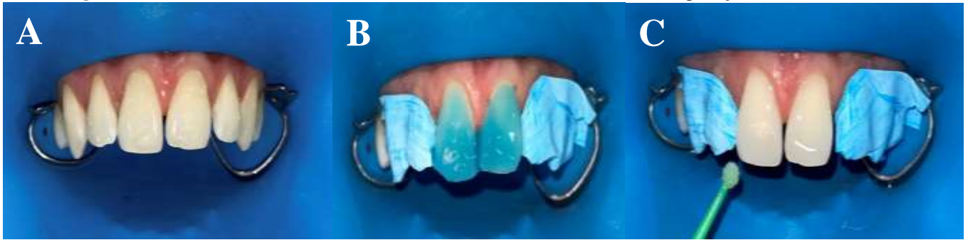
Figura 4 - A) Isolamento Absoluto modificado; B) Condicionamento ácido; C) Aplicação de sistema adesivo.