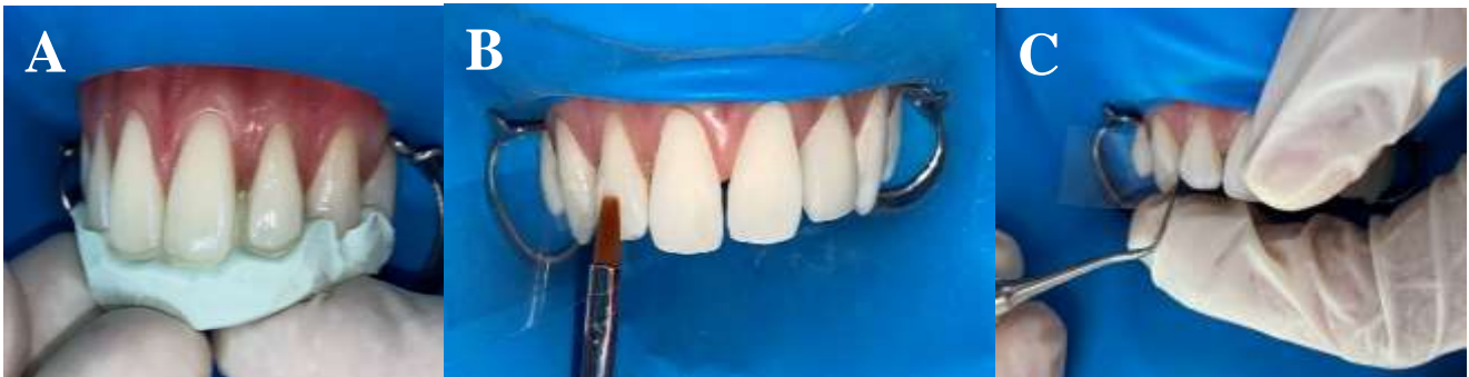
Figura 5 - A) Inserção de resina com guia palatino; B) Inserção da resina com pincel; C) Inserção da resina com espátula.

Com o auxílio da guia de silicone, a inserção de uma fina camada de resina composta foi iniciada para formar a face palatina e facilitar a inserção dos próximos incrementos. O guia preenchido com os compósitos foi levado aos elementos, firmemente posicionado e polimerizado por 20 segundos. Após a remoção do guia cuidadosamente, as tiras de poliéster foram posicionadas nas interproximais dos elementos e foi realizada a reconstrução em pequenos incrementos para reconstrução das faces proximais e vestibulares dos elementos utilizando espátula suprafill e pincel de pêlo sintético nº24 (Tokuyama, Japão) e fotopolimerização de cada incremento por 40 segundos. Contou-se também com um compasso de ponta cega e régua milimetrada para definir uma melhor proporcionalidade. Adiante foram feitos a remoção dos excessos cervicais com bisturi de lâmina 12 e ajustes das guias de oclusão com kit de pontas diamantadas F e FF (Figura 5).