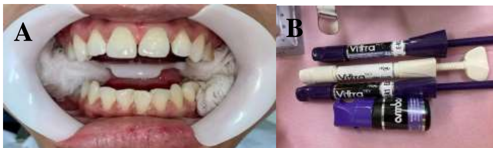
Figura 3 – A) Seleção de cor; B) Cores de resina selecionadas.

Em seguida foi feita a seleção de cor sob luz natural utilizando pequenos incrementos pela “técnica da bolinha” com possíveis opções de cores de resina colocadas nos terços cervicais, médio e incisal dos elementos, sem condicionamento ácido e sistema adesivo, somente com fotopolimerização para selecionar a cor ideal. As resinas selecionadas foram A1 (Vittra APS, FGM), Unique monocromática (Vittra APS, FGM) e E-Bleach (Vittra APS, FGM), tendo em vista que a paciente já havia sido submetida ao clareamento dental de consultório anteriormente (Figura 3).