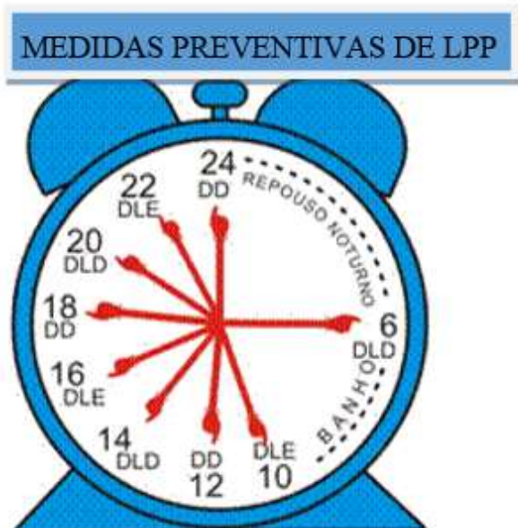
Figura1 - Cartilha para leitores sobre medidas preventivas de lesão por pressão.