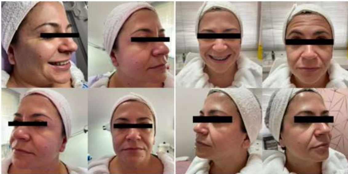
Figura 4 – Aparência geral da voluntária C antes do procedimento de RF e após dez sessões do procedimento de RF.

Aparência geral da voluntária C antes do procedimento de RF, nas fotos do lado esquerdo, apresenta flacidez na face, suco nasogeniano profundo e poros dilatados. Enquanto nas fotos do lado direito, após dez sessões do procedimento de RF, apresenta a pele mais firme, suco nasogeniano atenuado e redução na dilatação dos poros.