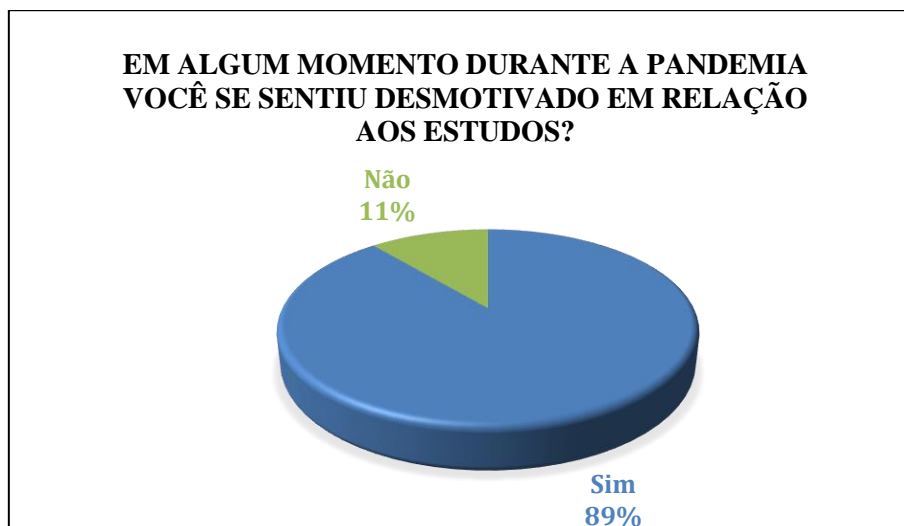
Gráfico 4: desmotivação em relação aos estudos durante a pandemia.

A quinta pergunta procurou saber se o ligante sentiu mais dificuldade em entrar na liga acadêmica por conta da pandemia do COVID-19. Observa-se que a maioria dos ligantes (67%) relataram que sim, sentiram dificuldade em entrar em uma liga. Mostrando que a existência da pandemia afetou de modo significativo.