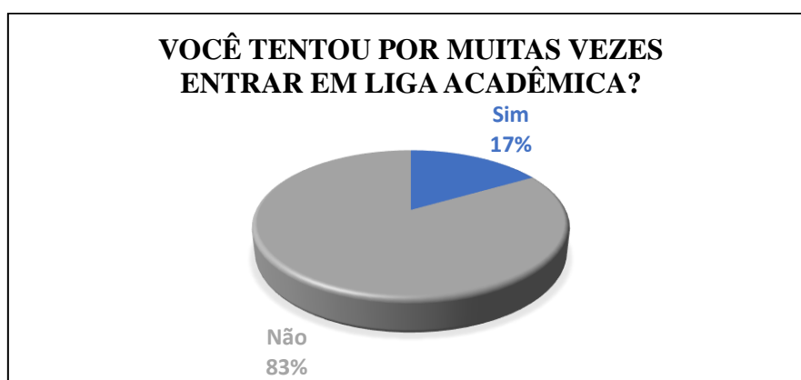
Gráfico 2: quantidade de tentativas para entrar em uma liga acadêmica.