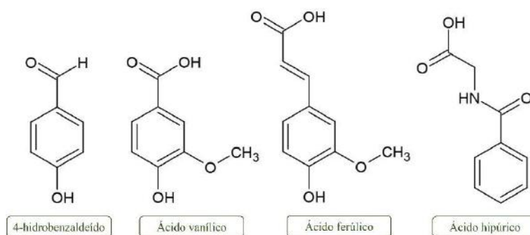
Figura 3: Principais produtos da degradação ou os metabólitos intestinais oriundos das antocianinas.

Estruturas químicas elaboradas no software livre ACD/ChemSketch.