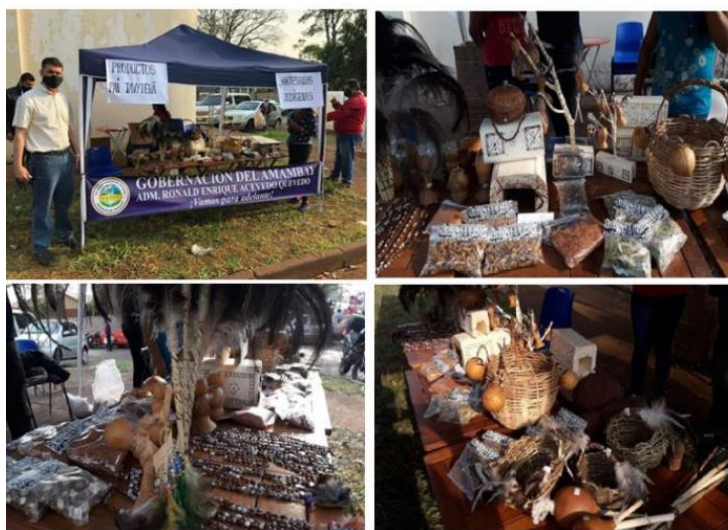
Figura 5. Produtos artesanais Indígenas da Colônia Paî Tavyterâ .