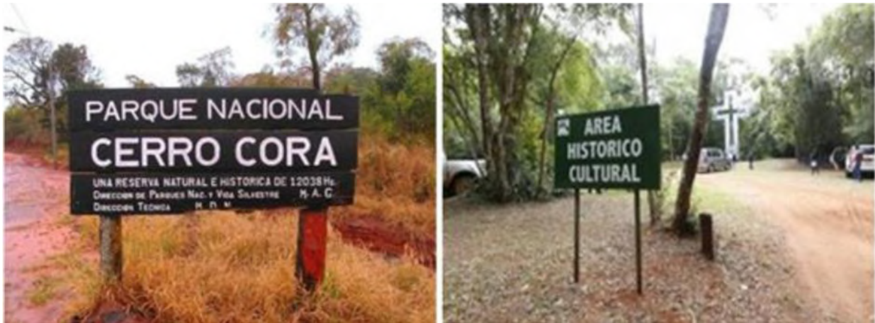
Figura 3. Parque Nacional do Cerro Corá.