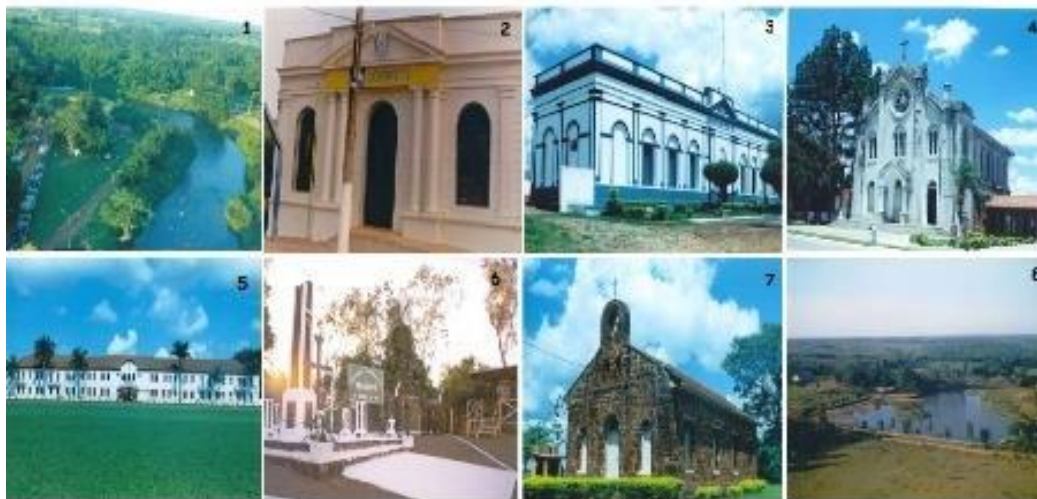
Figura 8. Pontos turísticos de Bela Vista – MS.