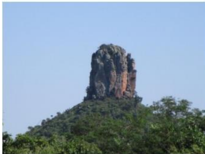
Figura 4. Cerro Akangué.