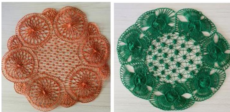
Figura 2. Peças de renda Ñanduti .

A Intendente Rojas (2000), em seu plano de governo, prevê ações para a produção e a comercialização da renda Ñanduti , proporcionando aos turistas locais de exposição e de revenda de peças.