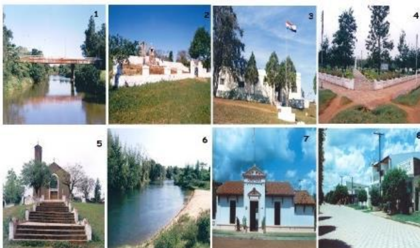
Figura 7. Pontos turísticos de Bella Vista Norte – PY.

Fonte: http://retiradalaguna.blogspot.com/2008/12/bella-vista-norte-paraguay-bela-vista.html .