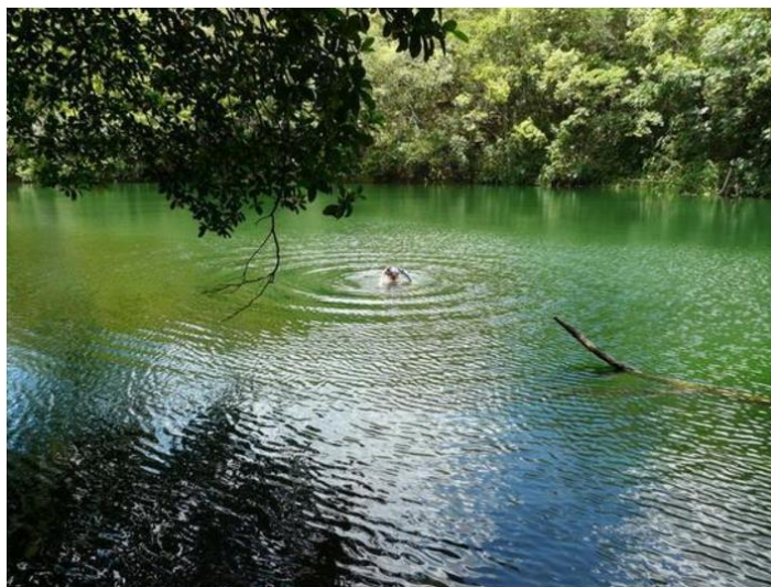
Figura 6. El Ojo del Mar.