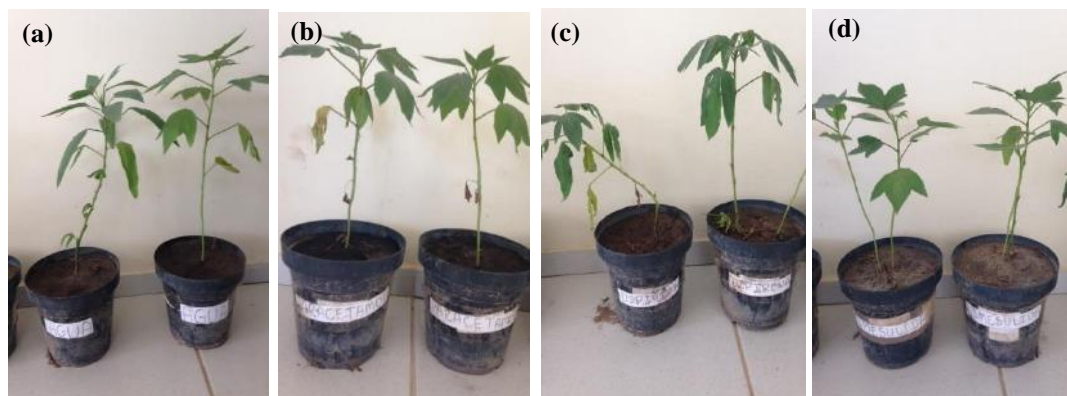
Figura 1. Hibiscus sabdariffa após tratamento com AINEs. (a). Grupo controle, (b). tratamento com paracetamol (750mg), (c). tratamento com dipirona (500mg) e (d). tratamento com nimesulida (100mg).

morfológicas e estruturais nos vasos regados com nimesulida. O grupo controle mostrou maior crescimento e suas folhas apresentaram aspecto morfológico saudável (folhas grandes e verdes), além disso, apresentou algumas folhas em desenvolvimento, o que não foi observado nas demais amostras.