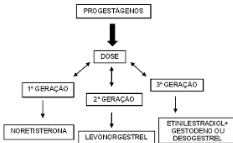
Figura 1: Divisão dos progestágenos. Brasil. 2022.

Segundo Figura 1 é possível notar que os progestágenos estão divididos em gerações: 1ª geração, os monofásicos que são considerados de baixa dose, como a noretisterona; 2ª geração, o levonorgestrel e norgestrel; 3ª geração, o etinilestradiol ligado com desogestrel ou gestodeno, possuindo doses mais elevadas (Cavalcante et al. , 2016; Cavalcanti et al. , 2015).