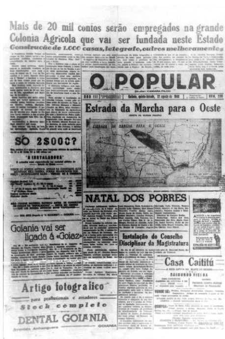
Figura 2: Recorte de jornal O Popular.

Jornais locais também estavam empenhados em contribuir para a divulgação dos ideais da marcha para o Oeste, exemplo disto está na Figura 1 que mostra o tipo de discurso que era utilizado, favorecendo a expectativa dos indivíduos de obterem terra para produzirem e melhorarem sua condição de vida.