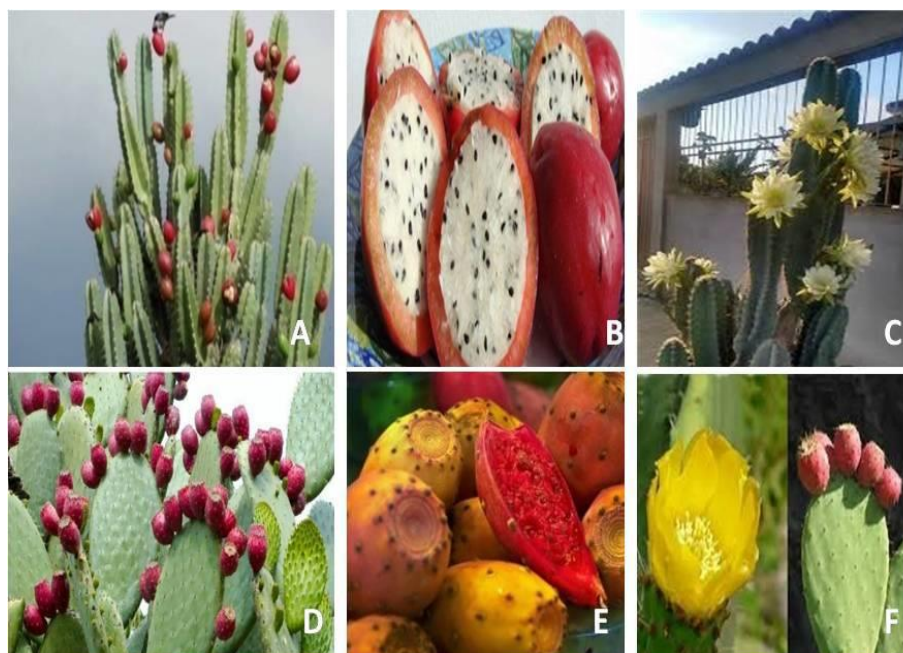
Figura 1 - Mandacaru e seu fruto; B) Fruto do mandacaru; C) Mandacaru e sua flor; D e F) Palma graúda, destacando-se seu fruto e flor; E) Fruto da palma graúda.