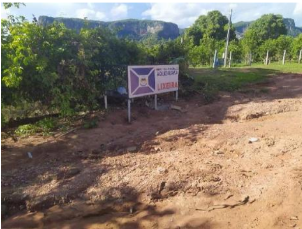
Figura 8 e Figura 9: Lixeira localizada na entrada que dá acesso ao Morro do Paxixi.

A beleza paisagística do local é ofuscada pela presença do lixo na região em diversos pontos. Na lixeira localizada na entrada da estrada que dá acesso ao Morro do Paxixi (Figura 8), local amplamente visitado, é possível identificar a presença de resíduos como garrafas pets e pratos plásticos, juntamente, aos galhos e folhas nas encostas da estrada de chão (Figura 9).