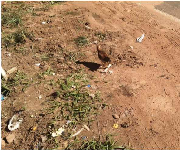
Figura 6 e Figura 7: Animais se alimentam do lixo na beira da estrada.