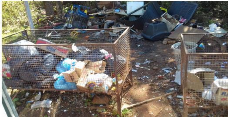
Figura 3: Lixo é apontado como um dos principais problemas ambientais pelos membros do Conselho Gestor da APA Estra Parque Piraputanga.