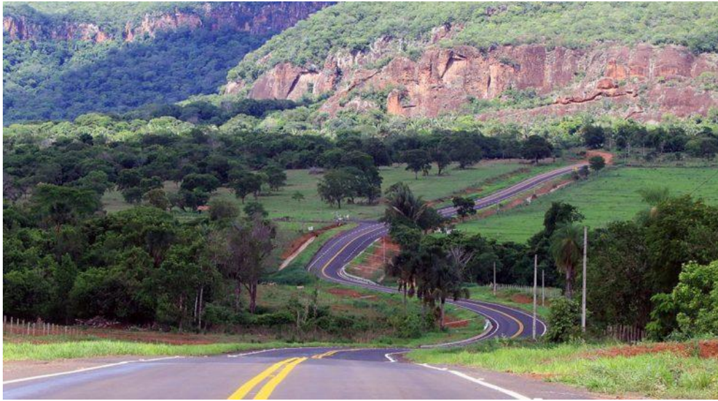
Figura 2. Asfalto da Estrada-Parque Piraputanga vai impulsionar o turismo e a economia local.