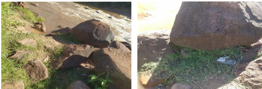
Figura 10 e Figura 11: Local que recebe turistas para banho e pesca no distrito de Camisão.