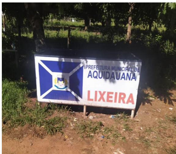
Figura 4 e Figura 5: Lixeira no distrito de Camisão, localizada a beira da estrada de acesso principal.

Conforme apontado por estudos científicos realizados na região, a gestão do lixo, se demonstra ineficiente para atender às necessidades dos Distritos. É possível identificar (Figura 4 e 5), uma das lixeiras disponibilizadas pela Prefeitura Municipal de Aquidauana, localizada na beira do asfalto no Distrito de Camisão, onde há resíduos caídos pelo chão e ao redor da lixeira, que fica localizada próxima a estrada.