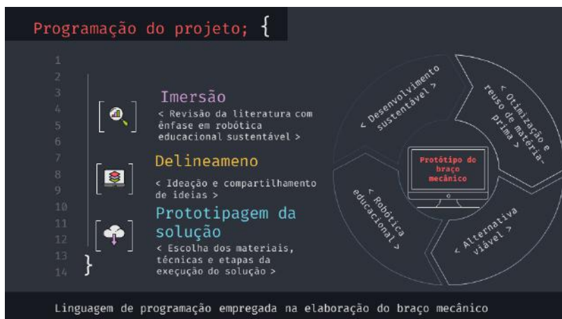
Figura 1 - Delineamento da proposta pedagógica em formato de linguagem de programação.