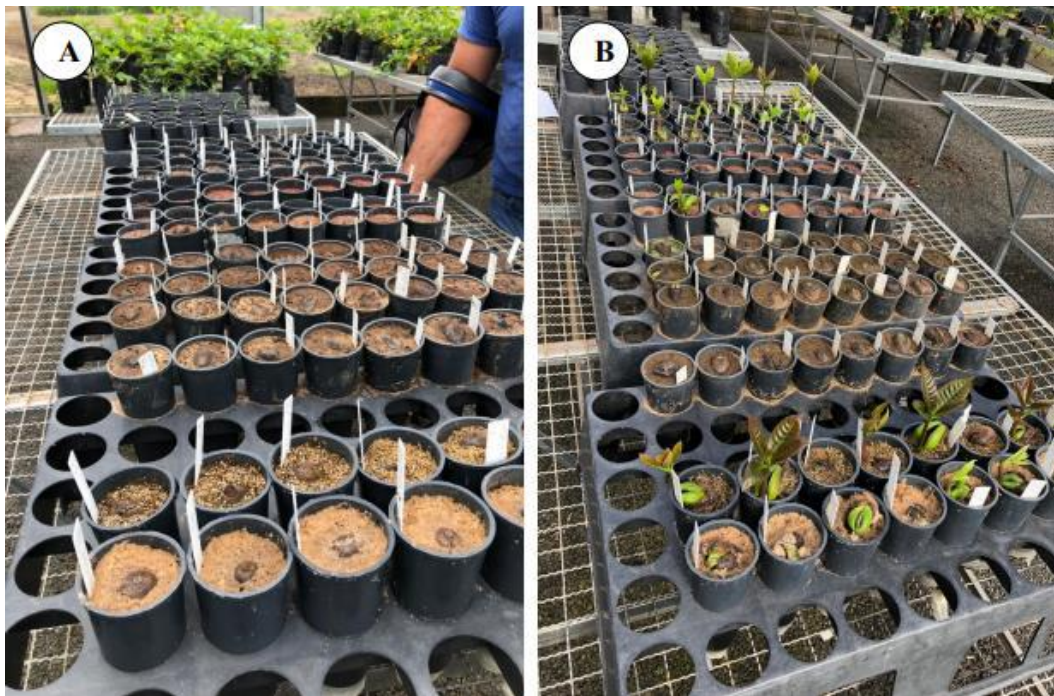
Figura 1: A – Montagem do experimento Figura 1: B – Castanhas germinadas.

As amostras de resíduos do fundo de três tanques escavados foram coletadas no município de Wanderlândia, Tocantins, no mês de agosto de 2019, vinte dias depois do descarte da água dos tanques, após a produção de alevinos de tilápia. Após a homogeneização das misturas realizou-se o enchimento dos tubetes com capacidade de 290 mL, que foram colocados em casa de vegetação. As castanhas foram extraídas do cajueiro CP 076 vigorosos e produtivos. Nos tubetes foram semeadas duas castanhas de cajueiro por tubete e, posteriormente, foi realizado o desbaste após as plântulas terem atingido 5 cm de altura, deixando apenas uma plântula por recipiente (Figura 1 A e B).